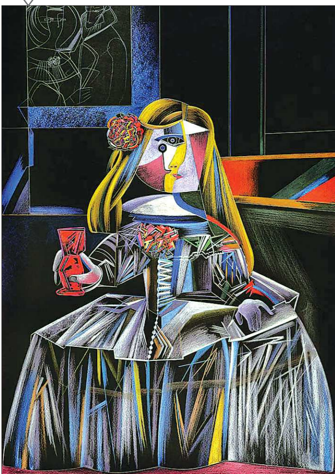
Михаил Шемакин. Серия «Трансформации Пикассо». №19 — «Инфанта», 1983-1990

В Екатеринбурге стартовал второй Евразийский форум современного искусства. В течение месяца в Ельцин-Центре будут проходить мастер-классы известных художников, открытые лекции и семинары, творческие встречи. Изюминкой форума станет выставка известного художника и скульптора Михаила Шемакина, на которой он представит серию работ «Трансформации Пикассо»