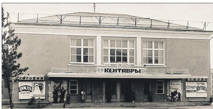
Впервые кинотеатр в Верхней Салде распахнул свои двери 50 лет назад — в 1966 году. Вчера же он пережил полноценное второе рождение — полностью модернизирован зал кинотеатра на 100 мест. В качестве премьеры в обновлённом зале зрители увидели отечественную комедию «Завтрак у папы»