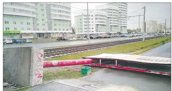
Порывы ветра были настолько сильными, что уронили на тротуар рекламный щит на Ботанике

Вчера в Екатеринбурге и соседних муниципалитетах области коммунальщики боролись с последствиями ураганного ветра, который пронёсся по области в четверг вечером. Электрооборудование восстановили уже наутро, а вот с остальными сюрпризами — упавшими рекламными щитами и вырванными деревьями — управиться уже в течение дня.