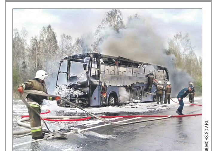
На трассе под Екатеринбургом сгорел пассажирский автобус «Темса». ЧП произошло около 6 утра 13 мая вблизи села Покровское Артёмовского района. Автобус ехал по маршруту 1047 из Тавды в Екатеринбург.

В момент возгорания в салоне находились 12 пассажиров и водителя, никто из них в результате ЧП не пострадал. До автовокзала Екатеринбург пассажиры доставили на другом автобусе, отправленном на замену сгоревшему.