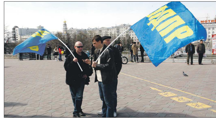
Нового местного руководителя свердловские либерал-демократы ждут уже полгода