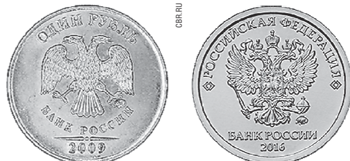
Несмотря на новый дизайн, вес рублёвых монеток остался прежним — 3 грамма

Впрочем, темнота не помешала уральцам выложить в сеть фотографии других последствий непогоды. В соцсетях появились снимки упавших дорожных знаков, заборов и деревьев, повреждённых балконов и крыш. Так, в нескольких районах Екатеринбурга не устояли рекламные щиты, на стройке в Кольцово башенный кран потерял лобовое стекло — оно упало на припаркованные автомобили. В центре города ветер снёс велопарковку, а возле одного из торговых комплексов перевернул бату на детскую площадку; родители и малыши успели разбежаться.