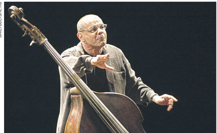
В 2000 году Константин Райкин был удостоен «Золотой маски» за лучшую мужскую роль в моноспектакле «Контрабас»