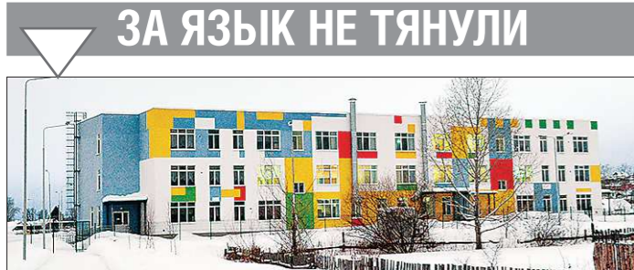
Строительство этого садика в посёлке Арти привело к жутким последствиям — участки вокруг красивого здания превратились в болота