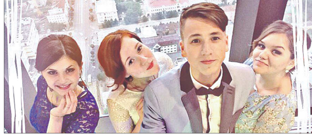
Выпускной без селфи на 51-м этаже «Высоцкого» уже принято считать неудавшимся. Устроить праздник похитнее нам активно навязывает общество потребления, и в выигрыше от наживы на родительских амбициях остаются только коммерсанты.