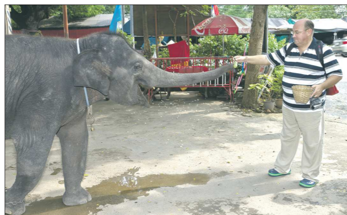
Считается: слон с поднятым хоботом привлекает в жизнь человека удачу. Но неплохо приложить в этом и собственную руку. Хоть в Индии, хоть в России

– По сей день?! – Без этого никак. Постоянно всё на слуху. И постоянно читаю о роке – кто, что, где. На каком-то этапе я даже предлагал: могу по памяти составить рок-энциклопедию. Распишу и группы, и составы, и альбомы. В алфавитном порядке... О, это большая часть жизни! В Уфе удалось создать клуб филологов. Удалось познакомиться с человеком, который написал вторую в СССР (после Ландсберга ) кандидатскую по рок-музыке. Он расширил мои горизонты. Вместе с ним я поехал в Ленинскую библиотеку, и в туалете (!) перефотографировал рок-энциклопедию Ивана Стамбуля . Без лишней скромности, у меня энциклопедические знания в области рок-музыки. Это единственное (альбомы), в чём я понимаю.