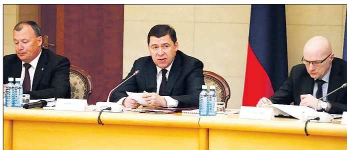
Евгений Куйвашев обозначил главам муниципалитетов ключевые условия развития территорий: повышение инвестиционной активности, поддержка малого и среднего бизнеса, мобилизация доходов бюджета

тысяч. Что символично, в этот день в Екатеринбурге посыл дал старт Международной туристической выставке «Лето-2016», страной-партнёром которой является Болгария. Однако цель открытия консульства — это не только увеличение турпотока в Болгарию, но и активизация бизнес-контактов со Свердловской областью. Так, вместе с послом в Екатеринбург прибыла делегация представителей предпринимательского сообщества, среди которых, в частности, были производители молочных продуктов. В перспективе планируется наладить здесь выпуск сыров и кисломолочной продукции, которую из-за санкций сейчас нельзя ввозить в Россию. Кроме того, в планах у болгарской стороны создание в Екатеринбурге Болгарского торгового центра, где будут продаваться только болгарские товары.