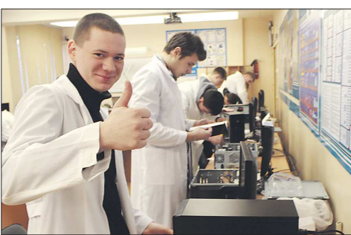
В ходе лабораторных работ студенты учатся собирать компьютеры