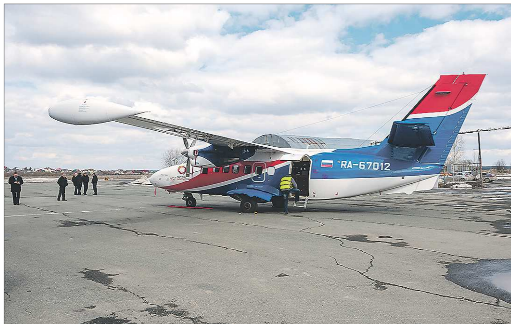
С 2017 года Уральский завод гражданской авиации будет производить в год от 6 до 12 таких 19-местных самолётов