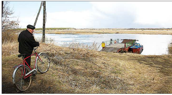
Мост к байкаловской деревне Красный Бор каждый год затопливает река Ница