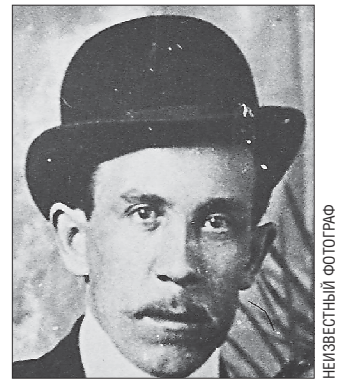
На этом фото Антон Валец, сыгравшего жениха в советском кинофильме «Свадьба»