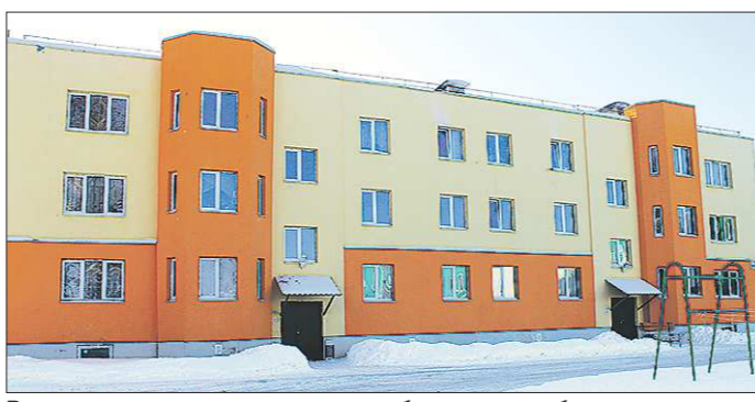
Внешне дома выглядят презентабельно, если бы не странная планировка...

В прошлом году «ОГ» нашла в одном из бывших общежитий Екатеринбурга самую крошечную жилую комнату области — размером в 6 квадратных метров.