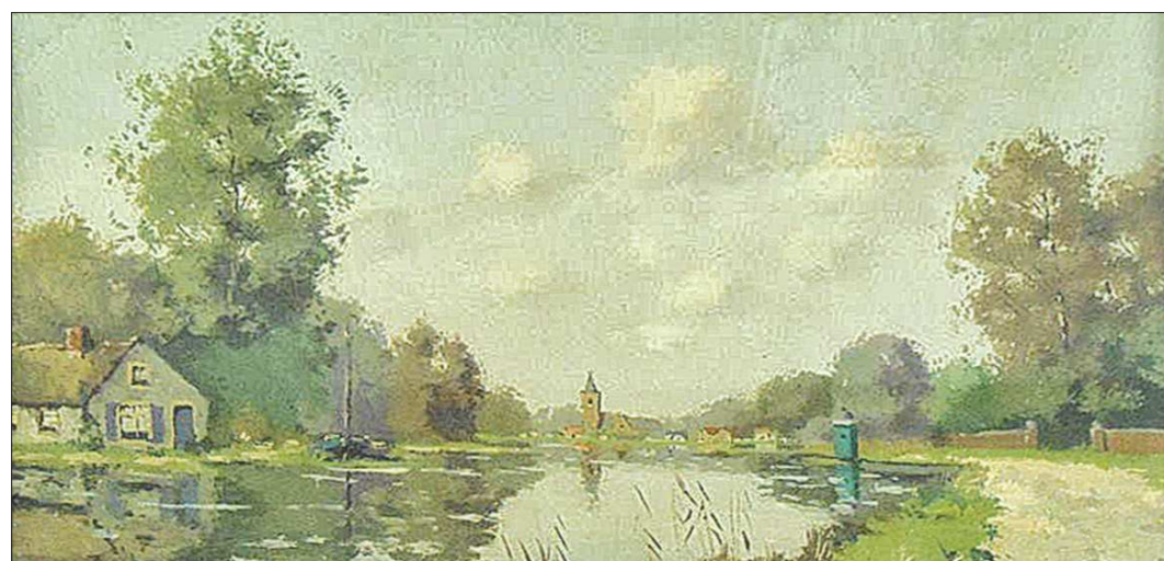
В разное время художник подписывался разными именами. В период 1914–1917 гг. он подписывался как N.BRUYNESTEYN – именно так и установили время создания картины