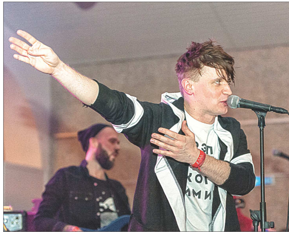
Группа «Сансара» – представитель нового поколения свердловского рока. Ещё больше фото – на нашем сайте oblgazeta.ru