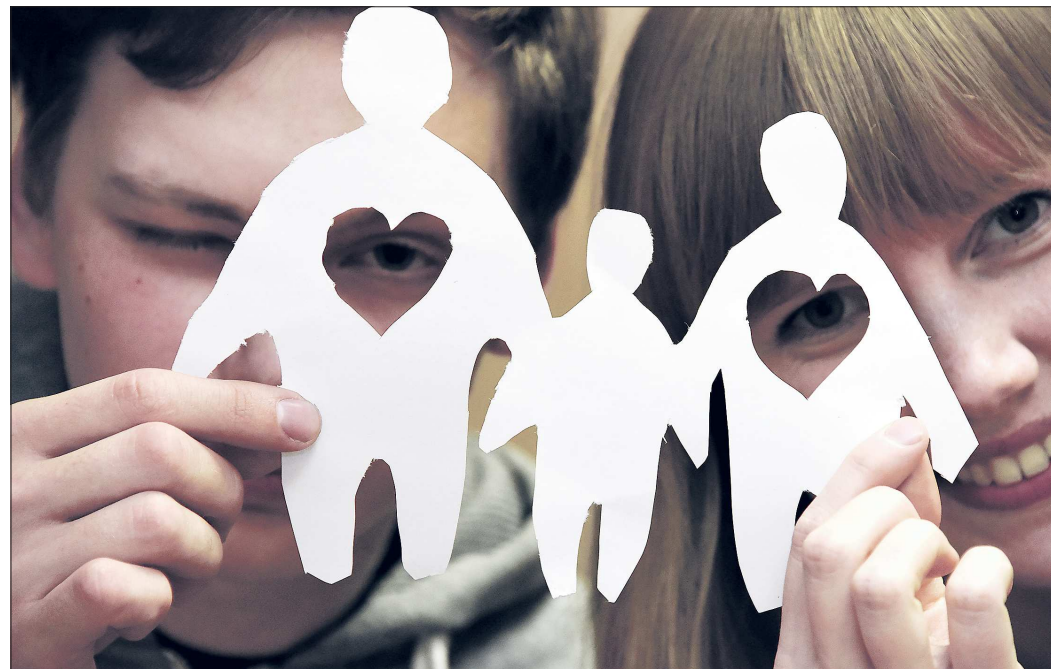
Кoeffициент рождаемости в Свердловской области достиг 14,5 на тысячу населения, что выше аналогичного показателя по России (13,3 на тысячу населения)

— В целях признания заслуг в воспитании детей знаками отличия Свердловской области «Материнская доблесть» различных степеней награждены более 2 тысяч 800 женщин, родивших или усыновивших и воспитав-