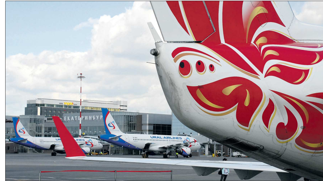
В десятке самых популярных направлений по числу перевезённых пассажиров (по убыванию): Москва, Анталья, Санкт-Петербург, Сочи, Симферополь, Хургада, Шарм-эль-Шейх, Новосибирск, Душанбе и Бишкек

Облюбовали наш регион и низкокбоджетные перевозчики — так называемые лоукостеры, которые предлагают низкие цены на свои маршруты при минимуме набора услуг (например, отсутствие питания на борту). Так, авиакомпания «Победа» раньше летала из Екатеринбурга в Москву и в летний сезон в Сочи, а с 24 октября открыла также рейсы в Санкт-Петербург и Новосибирск. При этом в пресс-службе Кольцово затруднились ответить на вопрос, сколько лоукостеров сегодня присутствует в нашем регионе, поскольку само понятие «низкокбоджетный перевозчик» законодательно не определено, а договоры у аэропорта со всеми авиакомпаниями одинаковые. Кто-то лоукостерами называет и Flydubai, и Finnair.