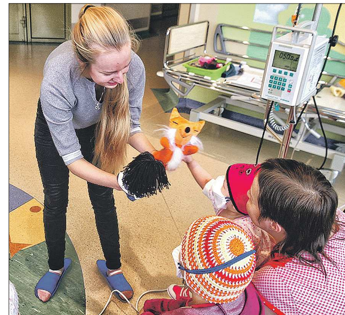
Волонтеры и сотрудники больницы знакомят малышей с героями сказок