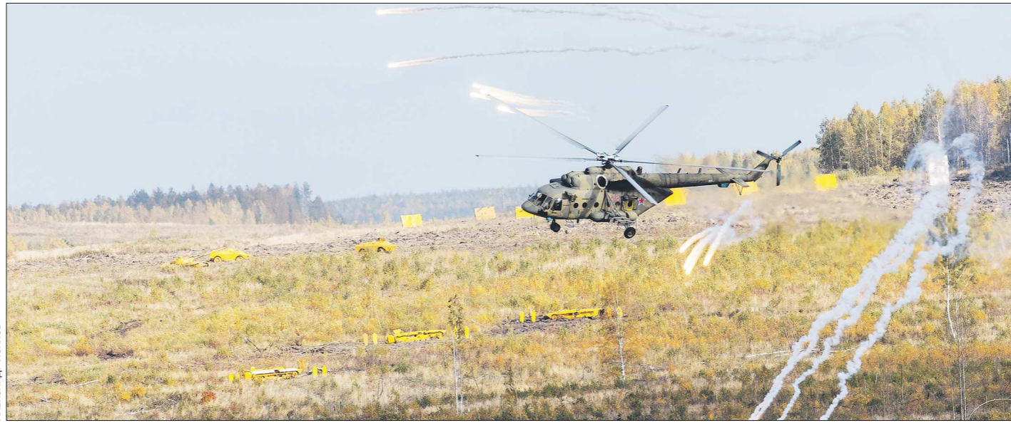
На «Раша армс экспо» в демонстрационном показе активно участвовала авиация, так что выставка уже перестала быть просто сухопутной

ВТБ активно взаимодействует со Свердловской областью с 2004 года, когда было подписано соглашение о сотрудничестве. Сегодня для кредитования региона у банка открыты лимиты в 25 миллиардов рублей, из которых области уже выдан кредит в 6 миллиардов.