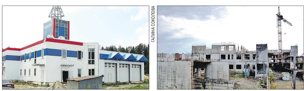
В деревне Починок Новоуральского ГО недостроенное пожарное депо брошено на разграбление