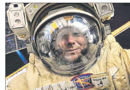
Во время своего десятого выхода в космос Геннадий Падалка сделал селфи

В субботу, 12 сентября, капсула космического корабля «Союз ТМА-16М» с россиянином Геннадием Падалкой, казахом Айдынмом Амметбеком и датчанином Андрасом Могенсенем приземлилась в степях Казахстана. При этом Геннадий Падалка зафиксировал свой мировой рекорд по общей продолжительности пребывания в космическом пространстве на отметке 878 суток.