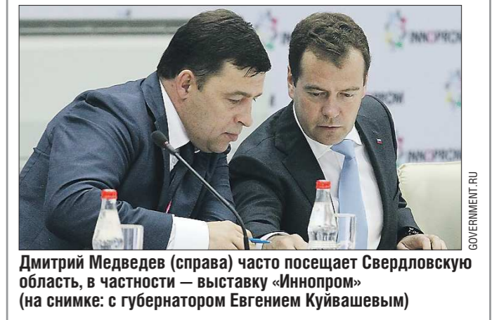
Дмитрий Медведев (справа) часто посещает Свердловскую область, в частности — выставку «Иннопром» (на снимке: с губернатором Евгением Куйвашевым)

Евгений Куйвашев пожелал премьеру новых успехов в ответственной работе на благо России, крепкого здоровья, энергии.