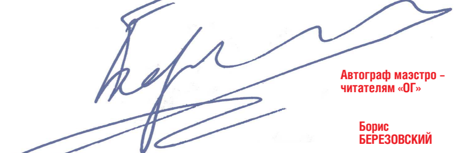
Автограф маэстро — читателям «ОГ»

— А вы, кстати, на сколько языков? — Русский, включая матерный, английский, французский. Кстати, про языки есть