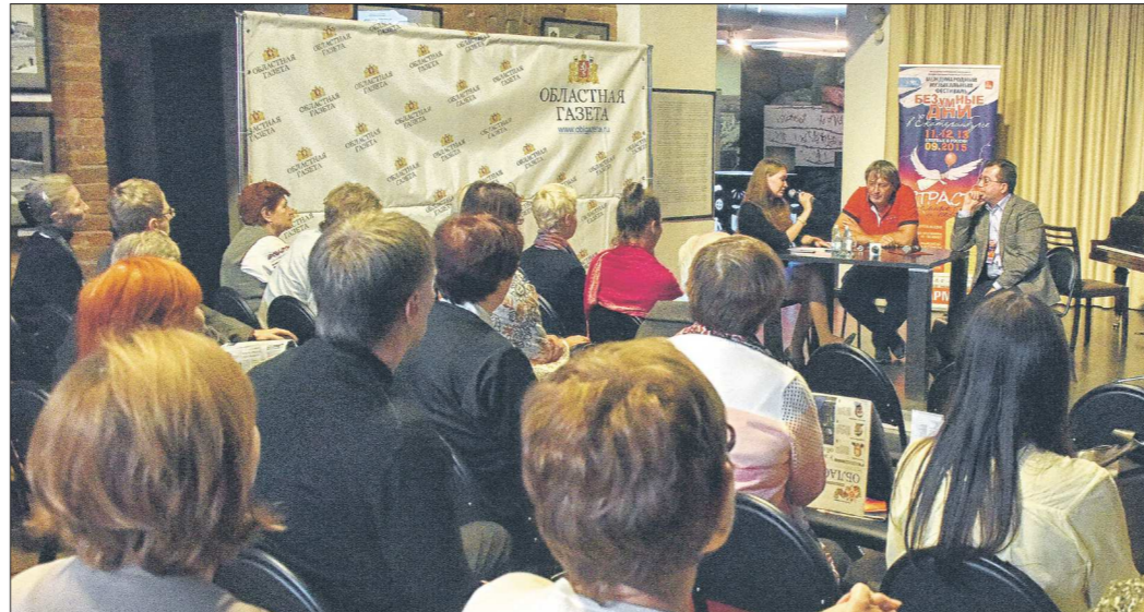
Встречи, организованные «ОГ» и Свердловской филармонией (у которой, кстати, начинается юбилейный сезон!) проходили в достаточно демократичной атмосфере. Даже сам Борис Березовский оставил концертный костюм и пришёл «в штатском»

— Кстати, в отличие от «Безумных дней» в других городах, где собираются многотысячные залы, у нас получилась более камерная атмосфера... — Это первый фестиваль в Екатеринбурге. И знаете —