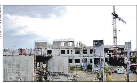
Многопрофильная детская больница в Нижнем Тагиле «строится» уже 20 лет