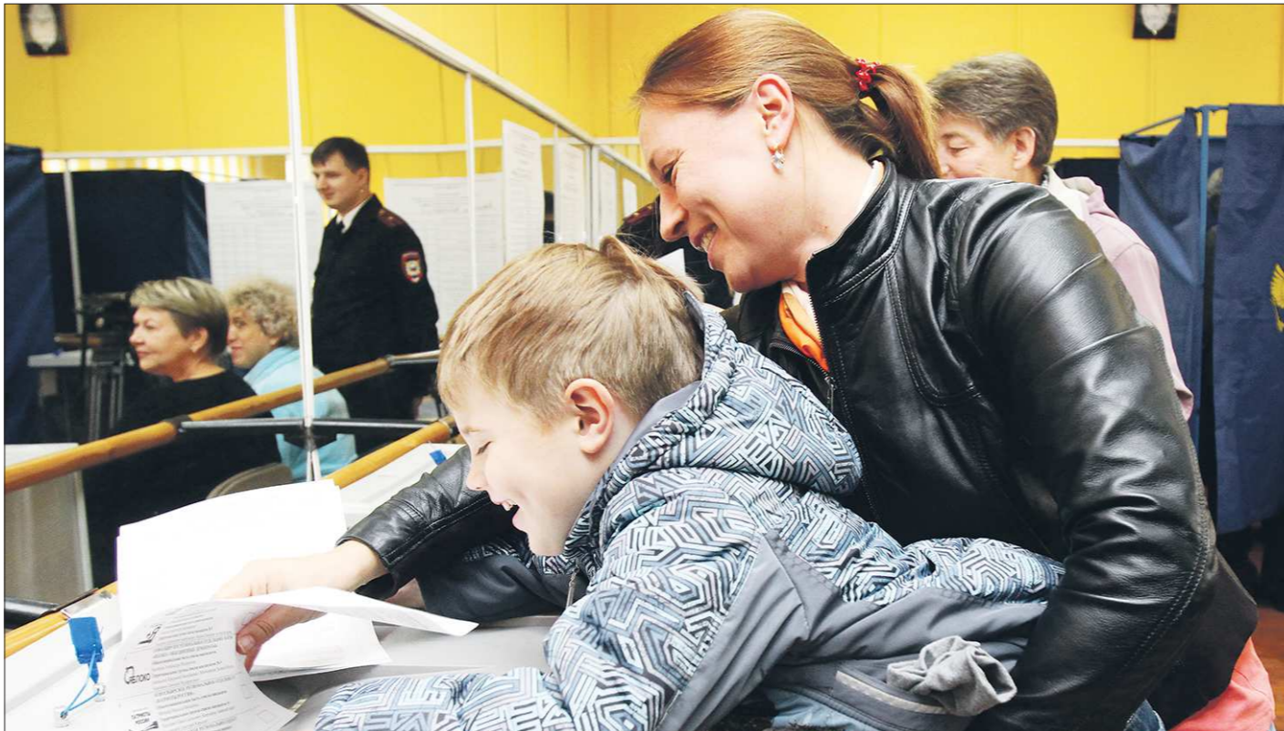
В этом году люди шли на выборы с большей охотой: явка избирателей составила 51,37 процента, что на 5 процентов больше результата аналогичных выборов 2014 года и на 17 процентов (!) — 2013 года