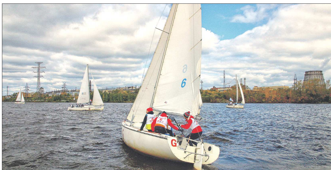
Самое главное в управлении яхтой – слаженная работа всей команды. Больше фото, а также видео – на нашем сайте oblgazeta.ru