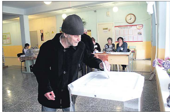
Самая высокая явка избирателей была отмечена в Унже-Павинском сельском поселении — 59,7 процента, самая низкая — в городе Лесном (16,08 процента)

— Среди вновь пришедших есть и люди с депутатским опытом. Результат голосования нам ещё предстоит оценить в работе, но в целом при-