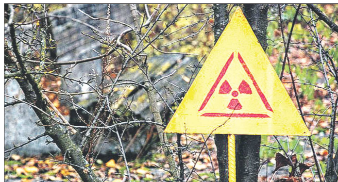
В 2014 году на Среднем Урале зарегистрировано 23 радиационных происшествия. Они связаны в основном с перевозкой металлолома, в котором находились источники радиационного излучения. Все опасные элементы захоронены в соответствии с нормативами

Мы продолжаем знакомить читателей с материалами государственного доклада «О состоянии и об охране окружающей среды Свердловской области в 2014 году» (см. «ОГ» от 27 августа и 4 сентября 2015 года). Сегодня речь пойдёт о радиационной обстановке. «Свердловская область в настоящее время является и в обозримом будущем останется регионом с повышенной потенциальной радиационной опасностью для населения и окружающей среды», – говорится в докладе.