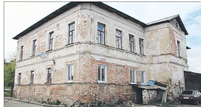
Это вид со двора, с улицы дом выглядит веселее, там даже сохранился ажурный кованый навес над парадным входом, забитым после революции

— Какие строители? Мы их тут почти не видели. Три дня побыли и ушли, ничего не сделали, — говорит жи-