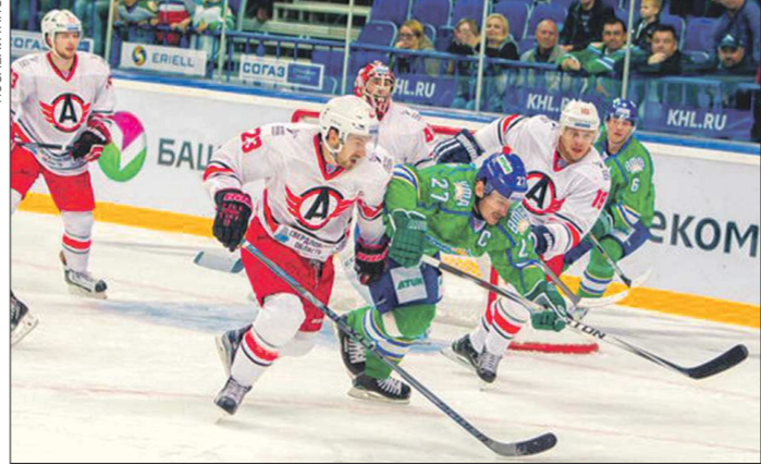
Уже в трёх играх между собой «Автомобилист» и «Салават» забрасывают девять шайб. И второй раз одна из команд побеждает со счётом 5:4. Но рекордный пок пок остаётся матч 2013 года, когда соперники забили 11 голов