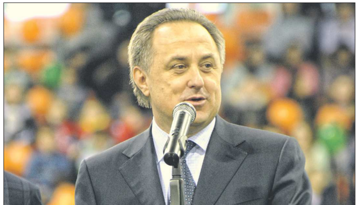
На выборах президента РФС Виталий Мутко был единственным кандидатом

Губернатор Свердловской области Евгений Куйвашев направил вчера поздравительную телеграмму министру спорта России Виталию Мутко в связи с избранием его президентом Российского футбольного союза.