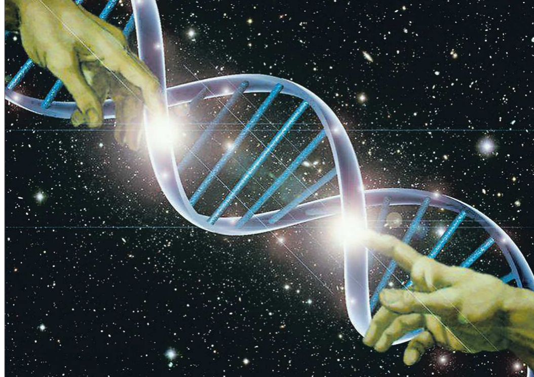
Учёные уверены: всё, что происходит с человеком, — результат работы его генов. Даже любовь

— Между тем доказано, что геном человека содержит гены бактерий и дрож-