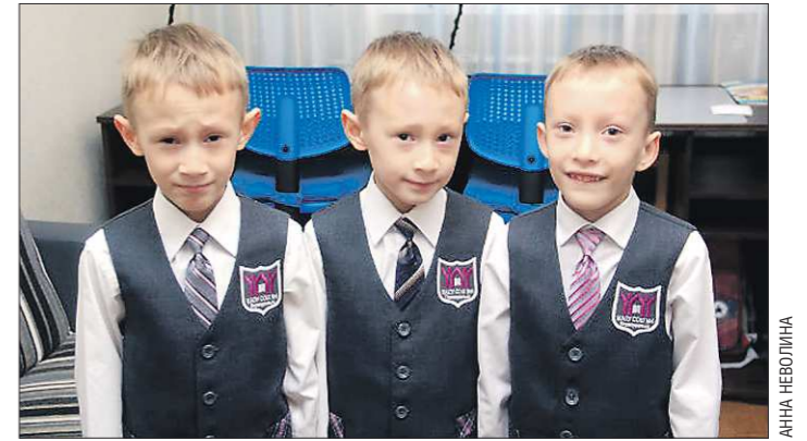
Ребята пообещали не меняться галстуками, чтобы на первых порах не вводить в заблуждение одноклассников и педагогов