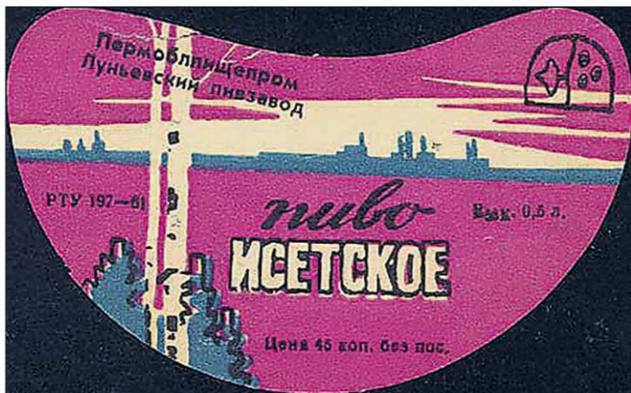
«Исетское» было элитным напитком, поэтому и стоило целых 45 копеек (а с 1985-го — даже 50) — это в два раза дороже, чем, например, широко известное «Жигулёвское»