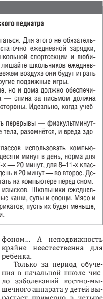
Источники: Министерство здравоохранения Свердловской области

Закрывает тройку «лидеров» школьных недугов заболевания органов пищева-