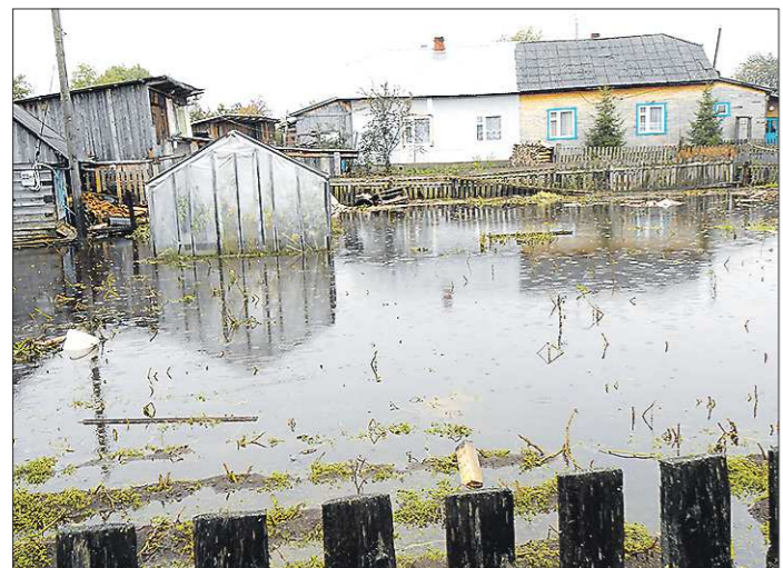
Так сейчас выглядят лобвинские огороды. Очевидно, что большинство посадок не удастся спасти

В прошлую субботу жители после ночной эвакуации добирались до своих домов в резиновых броднях. Сегодняшний уровень воды на улице позволяет ходить в обычных сапогах, но снижается он каждый день не более чем на два сантиметра. Напомним, в конце прошлой недели из-за обильных осадков река Лобва вышла из берегов. В результате оказались подтоплены семь улиц посёлка.