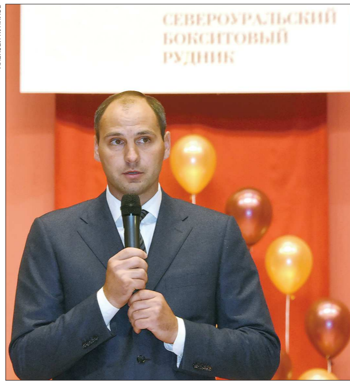
В Североуральске Денис Паслер свой: он здесь родился