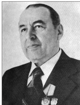
Георгий Дюмлер считал «Исетское» своим лучшим произведением

С большим содержанием несоложенного сырья тог-