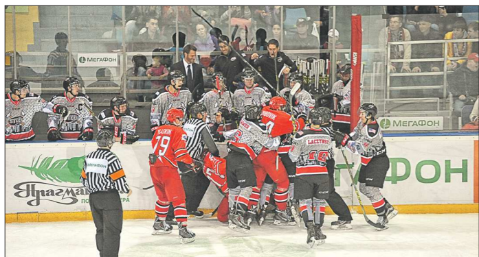
В матче с «Чикаго» у хоккеистов «Авто» одна заброшенная шайба и 38 минут штрафного времени