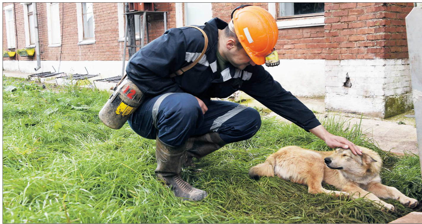
К собакам у шахтёров — отношение особое. В Кемеровской области даже есть памятник собаке, которая 15 лет спускалась в шахту

+/- — рост / падение по отношению к предыдущему показателю