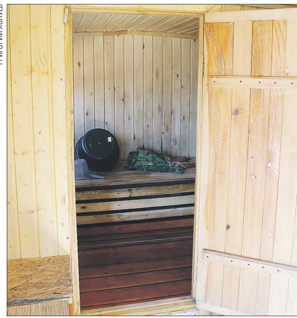
...а так изнутри