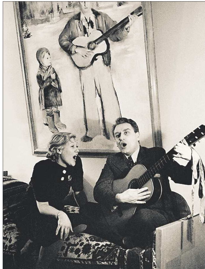
Любовь Орлова и Григорий Александров: настоящие (фото 1937 года)...

Кинорежиссёр Григорий Александров, подаривший миру «Волгу-Волгу» и «Весёлых ребят» и зажжённый одну из главных звёзд отечественного кино Любовь Орлову, родился и 18 лет прожил в Екатеринбурге. Но родной город к своему великому сыну оказался странно равнодушен: в столице УрФО нет ни памятника Александрову, ни улицы его имени, ни мемориальной доски