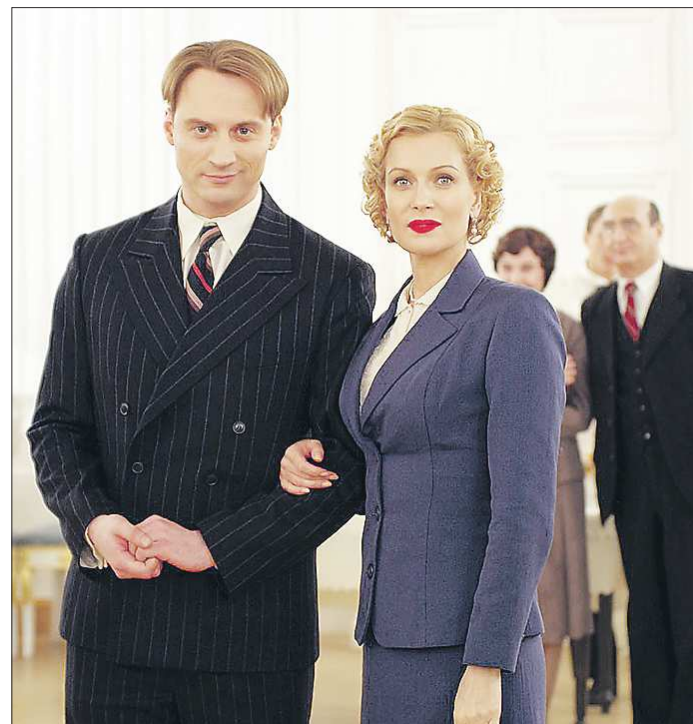
...и киношные (кадр из российского сериала, только что показанного по телевидению)

Кинорежиссёр Григорий Александров, подаривший миру «Волгу-Волгу» и «Весёлых ребят» и зажжённый одну из главных звёзд отечественного кино Любовь Орлову, родился и 18 лет прожил в Екатеринбурге. Но родной город к своему великому сыну оказался странно равнодушен: в столице УрФО нет ни памятника Александрову, ни улицы его имени, ни мемориальной доски