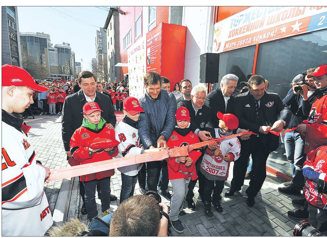
Символическую ленточку перерезают юные хоккеисты при поддержке Евгения Куйвашева, Алексея Яшина, Владимира Мышкина, Александра Якушева и Андрея Каримова