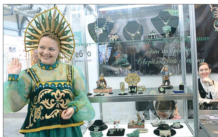
Сокровища уральских недр представляет Хозяйка Медной горы. И невозможно налюбоваться на камни, огранённые нашими мастерами

Кроме того, вчера же соглашения с общественными организациями о сотрудничестве по противодействию коррупции подписали четыре областных министерства (промышленности и науки, природных ресурсов и экологии, здравоохранения, общего и профессионального образования) и два контрольно-надзорных органа (Роспотребнадзор и Россельхознадзор).