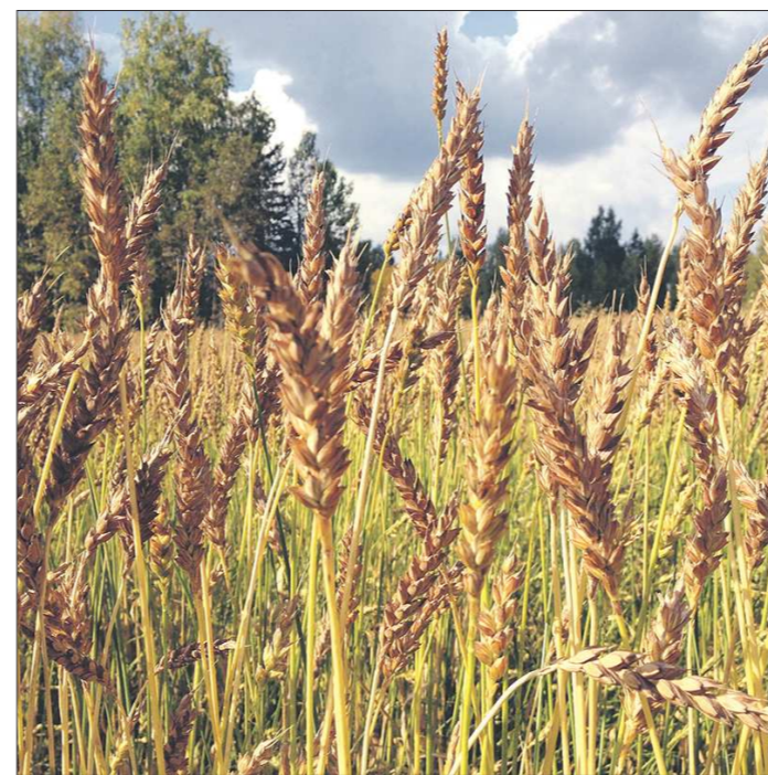
Во многих свердловских хозяйствах зерновые уродились не хуже, чем в прошлом году. Теперь главное, чтобы погода дала время на уборку урожая

— Плохи дела с уборкой. Идут дожди, из-за это-