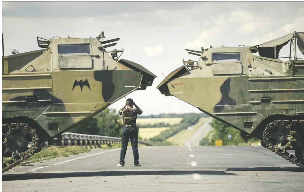
Боец ополчения на окраине Луганска после артиллерийского обстрела посёлка Металлист. Апрель, 2014 год