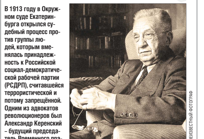
Александр Керенский умер в Нью-Йорке (США) в 1970 году, дожив до 89 лет