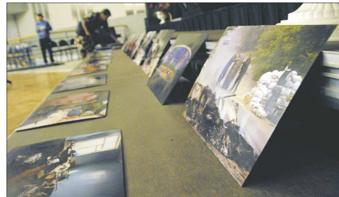
122 фотографии формата А3 — в фотосалоне за их распечатку запросили крупную сумму. Однако, узнав, что это для выставки с войны, владелица салона, пожелавший остаться анонимным, сделал весь заказ за свой счёт

Любопытно, что сразу после открытия выставки в зале имени Лаврова начнётся благотворительный концерт, на котором будут выступать хоры коллективы — в том числе детские, например, ка-