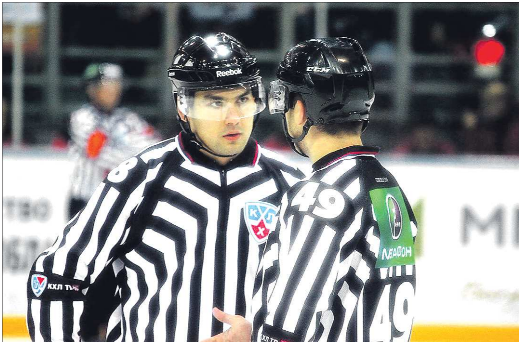
Чтобы работать в новых условиях, судьи должны первыми выучить новые правила наизубок

Несколько важных нововведений начали действовать в сезоне 2014/2015 в хоккее. По большому счёту, это очередной шаг к сбли-