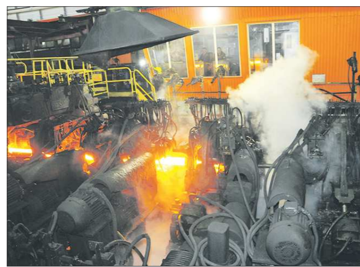
Уральский металл без покупателей не останется

Компания «ВИЗ-Сталь» увеличила выпуск продукции в первом полугодии 2014 года