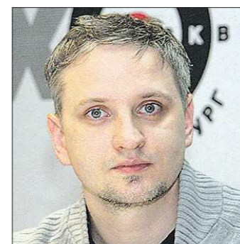
ОМНЕМА ДИВА АФИШЕДЕ

Каждую неделю один из наших гостей — известных уральцев — представляет свою оценку афиши культурных и спортивных событий на ближайшие дни.