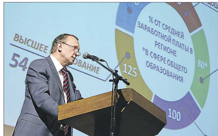
На повышение зарплат учителям в ближайшие три года выделит 12 миллиардов рублей

— Достойная оплата труда позволит педагогам полностью сосредоточиться на качестве учебного процесса, — отметил он.