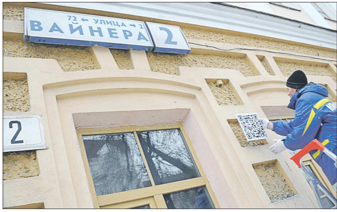
Центральный институт был первым зданием в Екатеринбурге, получившим такую табличку

Гораздо более реально, что управлять российскими авиалайнерами будут пилоты из Германии и Чехии, тех стран, в которых авиационная отрасль испытывает определённые трудности. «Заявки есть, есть люди, но до сегодняшнего дня закон не разрешил брать на работу лиц с паспортами других государств», — добавляет эксперт. Между тем, по информации «ОГ», основной свердловский авиаперевозчик — «Уральские авиалинии» — пока не собираются набирать к себе на работу иностранцев, хватает своих пилотов.