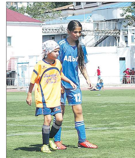
Екатеринбургские спортсменки сильно уступали соперницам в росте, но это не мешало им выиграть