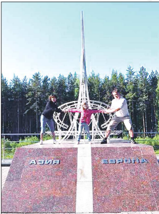
Любимая поза на снимках у таких обелисков — широко расставленные ноги, одна — в Европе, другая — в Азии. На самом деле обе ноги в Азии