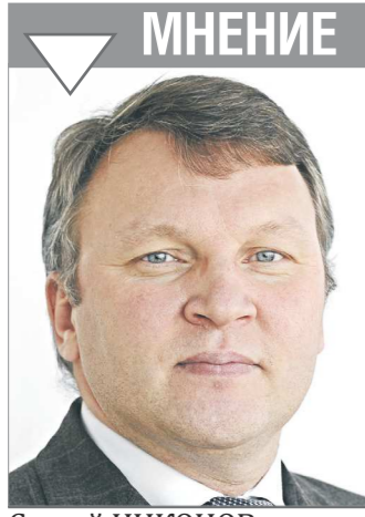
СЕРГЕЙ НИКОНОВ, депутат Законодательного Собрания Свердловской области