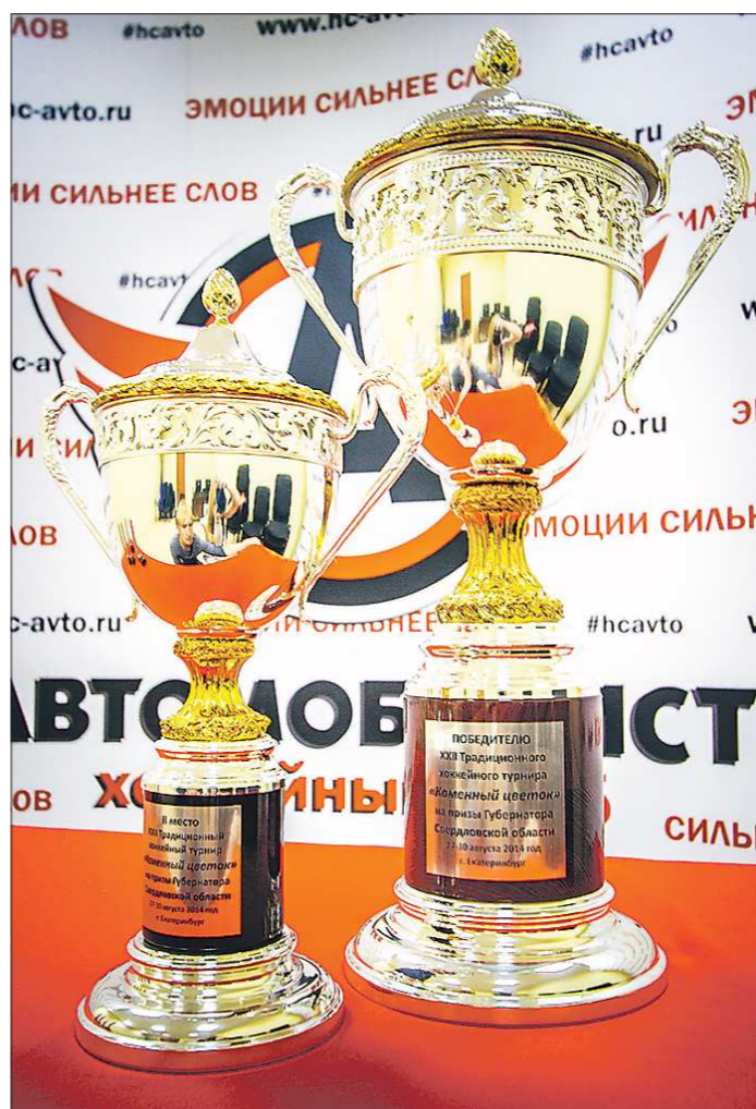
Впервые кубок будет вручен не только победителю турнира, но и команде, занявшей второе место — точно такой же, как победителям, но меньшего размера

После каждой игры будут определяться два лучших игрока (по одному из коман-