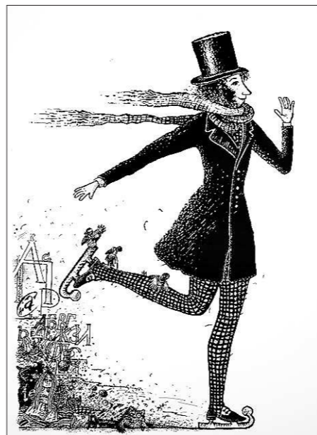
Сергей Айнутдинов. Работа из серии «Литератушки». Шелкография

— Неудивительно. Вряд ли какая-то современная техника сможет вызвать такие эмоции.