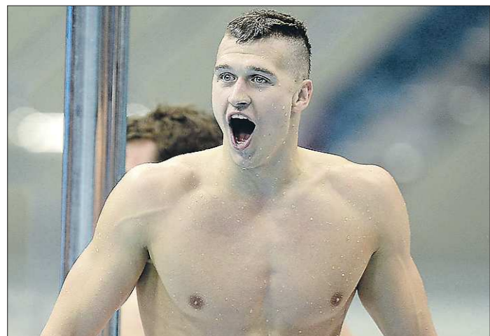
Теперь в коллекции свердловского пловца четыре медали чемпионатов Европы — две золотых и две серебряных