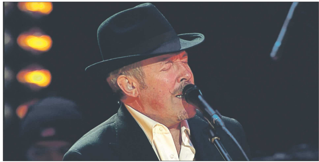
Андрей Макаревич: «Не стоит прогибаться под изменчивый мир...»

* QR-код — матричный код, посредством которого зашифровывается определённый объём информации. Считывают информацию при помощи сканирующих устройств, например, мобильного телефона. Один QR-код может содержать 7089 цифр или 4296 символов