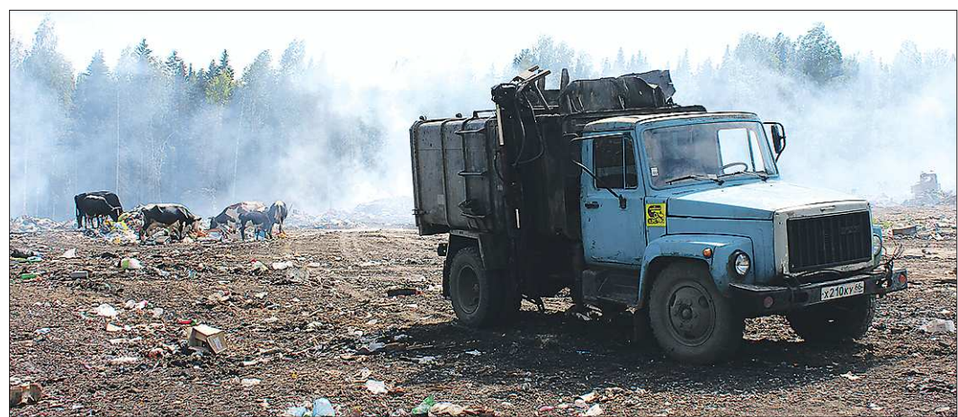
Коровы на шалинской свалке радостно встречают местные мусоровозы и спешат «к столу»

Через несколько дней была объявлена война с Германией и мобилизация за мобилизацией стала уводить людей из нашего села на защиту нашей дорогой матушки России».