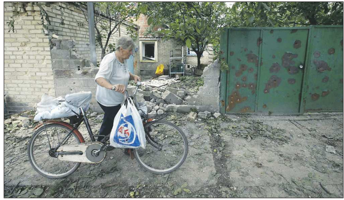
В полуразрушенном городе самый надежный транспорт – велосипед

Поток беженцев из Украины в Россию, на Урал, растёт едва ли не в геометрической прогрессии. Люди бегут от войны буквально в тапочках, прихватив только документы, да самое необходимое. Страшно представить, каково тем, кто не успел, не смог из-за артобстрелов, бомбёжек вовремя покинуть родные хаты. Корреспонденты «ОГ» попытались дознаться в городах, названия которых постоянно звучат во фронтовых сводках.