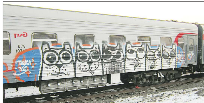
На очистку и покраску каждого вагона требуется около четырёх дней. Деньги, выделяемые на ремонт, можно было бы потратить на новое вагонное оборудование