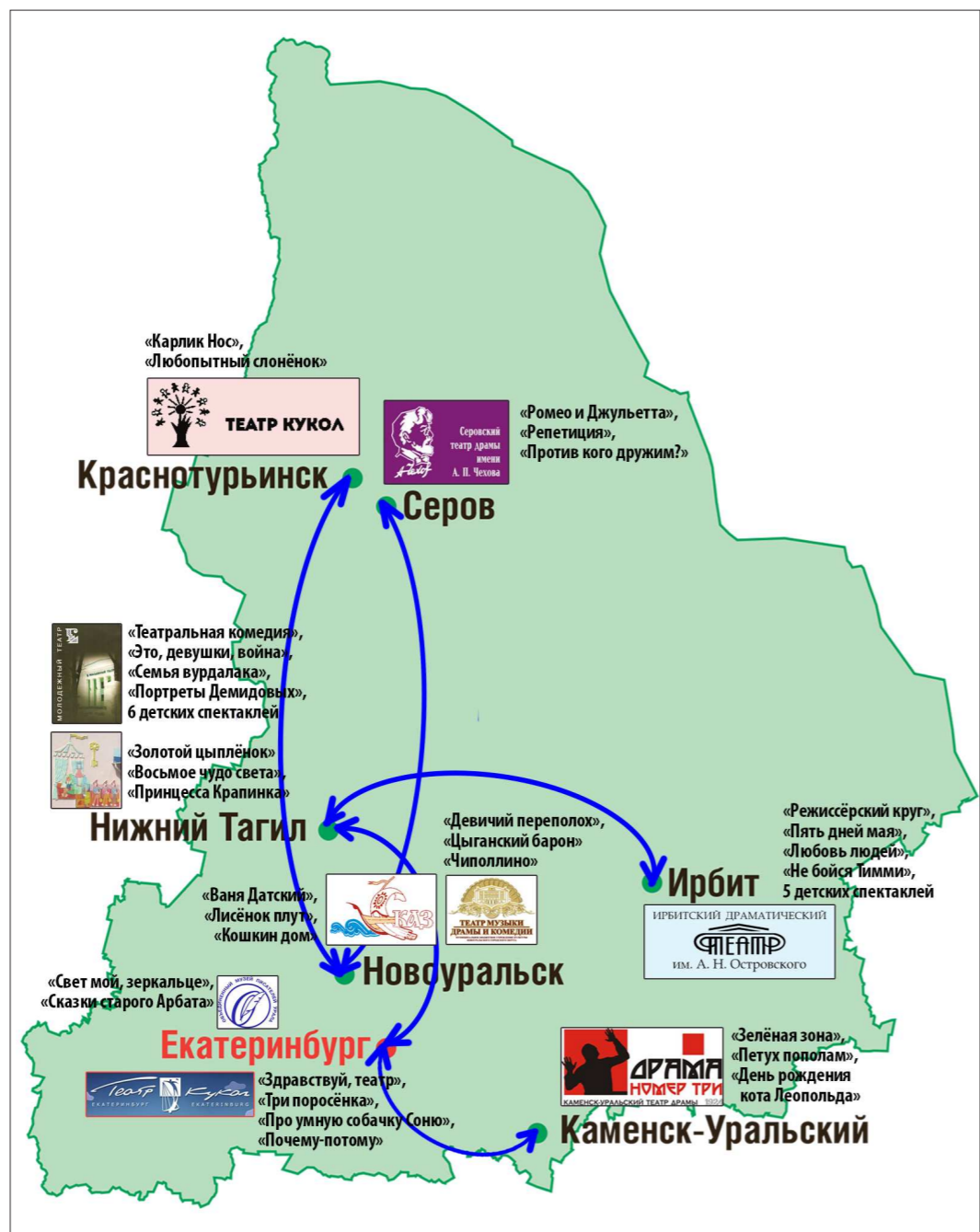
ОБЛАСТНОЕ УПРАВЛЕНИЕ КУЛЬТУРЫ

Впрочем, такие гастроли, разумеется, прежде все-