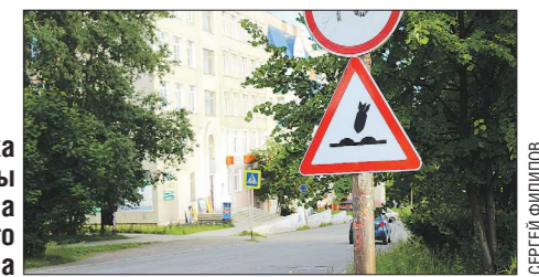
Два таких знака на улицах Ленина и Ленинского Комсомола

Подобных знаков нет ни в одном учебнике по правилам дорожного движения, поэтому местным жителям остаётся только догадываться, что это значит. Некоторые уверены, что это — напоминание местным властям об ужасном состоянии дорог в городе, сообщает газета «Вечерний Краснотурьинск».