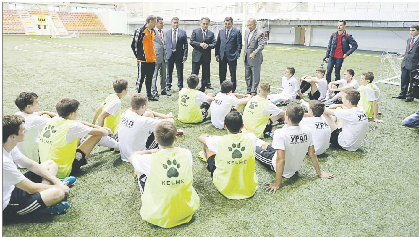
ПРЕСС-СЛУЖБА СВЕРДЛОВСКОЙ ОБЛАСТИ

Впрочем, несмотря на решительный тон министра, не стоит упускать из вида то, что