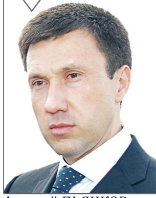
Алексей ПЬЯНКОВ, министр по управлению государственным имуществом Свердловской области