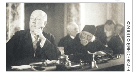
Слева – академик Александр Ферсман, возглавлявший Уральский филиал АН СССР, правее – академик Александр Карпинский

В 1932 году в Свердловске начала работу выездная сессия Академии наук СССР во главе с её президентом академиком Александром Карпинским.