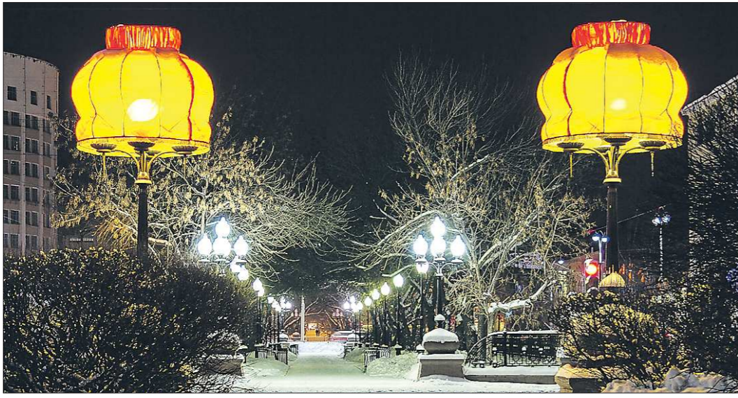
Одна из самых известных работ Ради - абажуры на проспекте Ленина в Екатеринбурге. Добавило славы этой работе требование городских властей демонтировать конструкции. Абажуры сняли, но через некоторое время по просьбе горожан их вернули...

— Что такое опасность? Её можно встретить и днём. Бывает, подходят случайные прохожие, спрашивают, что я делаю. Я всегда объясняю. Иногда это кого-то не устраивает, но это уже не моё дело. Если подходят сотрудники правоохранительных органов, тоже вежливо всё рассказываю. Обычно моих объяснений хватает. Но в Октябрьском РУВД где-то должна быть моя фотография на фоне линейки. Насчёт страхи... не страшно делать то, что умеешь. У любого здорового человека есть страх высоты, но можно научиться работать