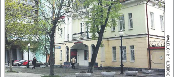
Сегодня здание первой советской сберкассы Екатеринбурга занимает военный комиссариат Свердловской области