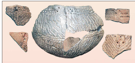
Кокшаровский холм. Ритуальные сосуды с тотемными изображениями

— Многолетнее знание археологией повлияло на