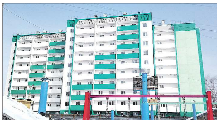
Почти половина квартир в этой новостройке оплачена за счёт федеральных и областных средств. Кроме детей-сирот, льготное жильё здесь должны получить 20 малоимущих и многодетных семей