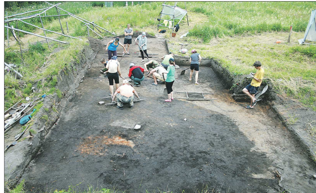
Кокшаровский холм, 2013 год. Святилище эпохи неолита. Процесс раскопок

— Клады попадают не часто. Ведь желание что-то спрятать появляется лишь в случае приближающейся опасности и нежелании делиться ценностями. В ранних эпохах, при коллективной собственности на средства производства и распределение продукта, накопить богатство не представлялось возможным. Да и военных столкновений было мало — отбирать того нечего. С появлением бронзы всё изменилось. Бронза стала крайне ценным предметом. Так