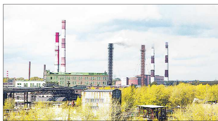
Проект реальной санитарно-защитной зоны «Русского хрома» два года назад был направлен на экспертизу в Роспотребнадзор. Руководство завода утверждает: по этим расчётам, новостройка вне опасности