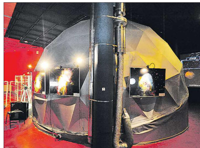
Под этим куполом диаметром в семь с половиной метра умещается вся Вселенная!

Цифровой планетарий — это первый проект обоснован-