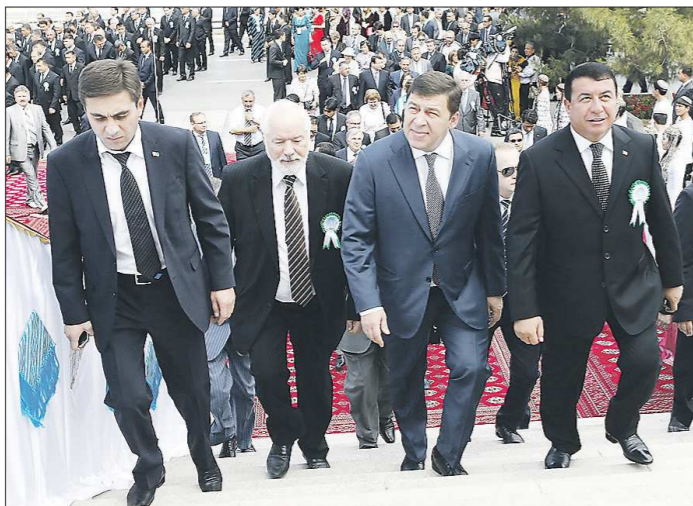
Делегацию Среднего Урала, приехавшую в Туркменистан, возглавляет губернатор Евгений Куйвашев (второй справа)

Свердловская область продолжает налаживать контакты с государствами СНГ на южных рубежах страны. В марте был визит губернатора и уральских предпринимателей в Азербайджан, а сейчас делегация региона во главе с Евгением Куйвашевым находится в Ашхабаде. Представители области проведут здесь ряд встреч с руководством Туркменистана, в ходе которых обсудят перспективы долгосрочного сотрудничества, сообщает департамент информационной политики губернатора.