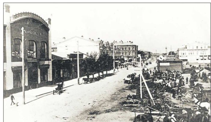
Слева – магазин «САВторова» – об этом свидетельствует надпись на фасаде. Примерно здесь сейчас располагается «Успенский». Правую сторону улицы не узнать – там останавливались повозки, были небольшие лавочки...

Следующее название улицы было куда торжественней и солидней. Оно связано с открытием Ново-Тихвинского