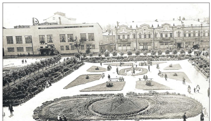
А вот как эта часть улицы выглядела после 1930-го, когда на месте старого магазина возвели первое здание Театра драмы. Снимок сделан из окна Горсовета, на переднем плане – сквер возле Пассажа