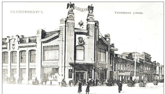
Русско-французское предприятие «Проводник» славилось своими калошами – шик моды! Вход был увенчан двумя огромными орлами. Их сбросили в 1917-м, позже здание надстроили

смогли сбить огонь: струи воды на трескуем морозе застывали... Кстати, в последние упомянутые даты – декабрь 1924 года и 1925 год – улица уже носила другое имя, которое оказалось тоже долговечным – Вайнера.