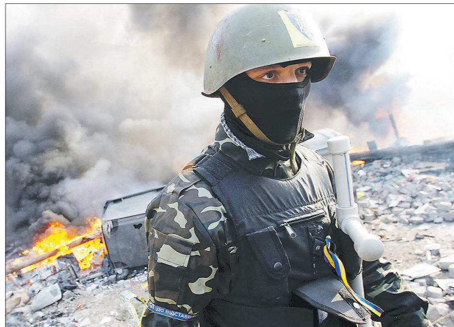
Солдаты украинской армии сегодня получают мизерное жалованье, а вот добровольцам «территориальных батальонов» украинские олигархи обещают по 10 тысяч долларов за каждого убитого «москаля»

Ведь срок годности боевой техники, доставшейся Украине от СССР или уже истёк, или истекает в ближайшие несколько лет. Из-за этого на прошлогодних учениях, например, произошло несколько самопроизвольных подрывов зенитных ракет ПВО сразу после пуска. Технику надо обновлять, но несмотря на то, что Украине достался мощный оборонно-промышленный комплекс, замена и модернизация многих видов оружия невозможны без участия предприя-