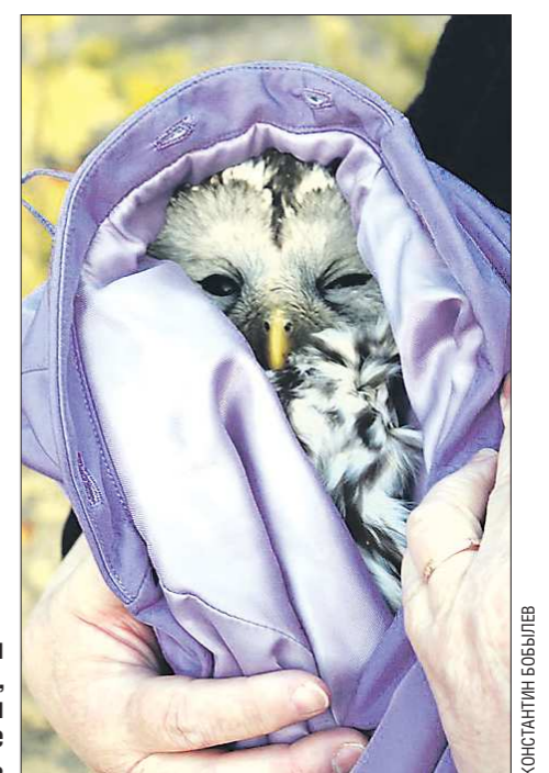
Перед тем как отвести в лес, сову запеленали в куртку. Птица не сопротивлялась