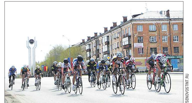
Для проведения соревнований были перекрыты проспекты Вагоностроителей и Дзержинского