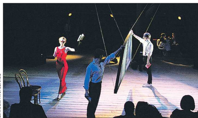
Эскиз спектакля «А.Каренин» впервые был представлен на презентации книги Сигарева «Замочная скважина»

Конечно, чтобы быть писателем, членство в союзе далеко не обязательно. К тому же, кроме билета, союзу почти ничего предложить начинающему литератору — разве что при случае выдвинуть на какую-нибудь премию или субсидию областного минкульта. Но писатель, как и любой творческий человек, всегда будет нуждаться в профессиональном признании коллег. А уж этого в союзах — с избытком.