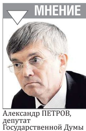
Александр ПЕТРОВ, депутат Государственной Думы