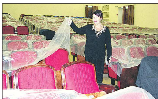
Тагильский ДК «Юбилейный» пережил ремонт в прошлом году, на бюджетные средства здесь обновили зрительный зал и фойе