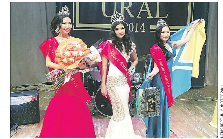
Победительницы конкурса «Мисс Азия-Урал» - 2014 в награду получили турпоездку в Италию, гаджеты, сертификаты в ювелирные магазины и сами ювелирные украшения

Разумеется, без бумажной волокиты не обойтись, тем не менее тем, у кого российские корни и для кого русский язык — родной, и уж тем более, есть родственники в России, путь к российскому паспорту станет намного короче.