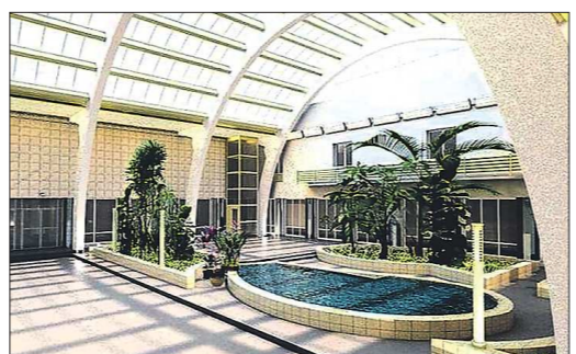
Если верить эскизу, облик карпинского ДК изменится до неузнаваемости. В холле и фойе уложат белую плитку и разместят мягкую мебель