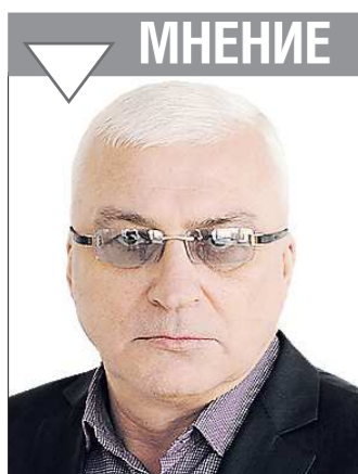
Александр НОВОКРЕЩЕНОВ, депутат Законодательного Собрания Свердловской области