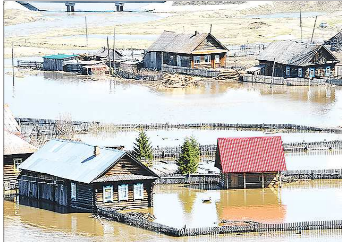
«Дикая Утка разошлась»

В ночь на понедельник в городском округе Староуткинск произошло самое крупное за последние 35 лет наводнение. Затопленными оказались более 20 придомовых участков в посёлке Староуткинск и деревне Волыны. Сейчас уровень воды постепенно снижается. Человеческих жертв нет.