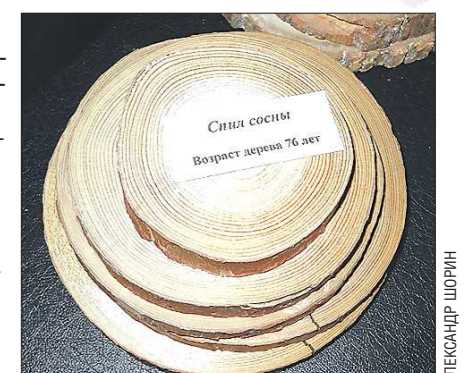
Среди экспонатов — спилы самых старых деревьев