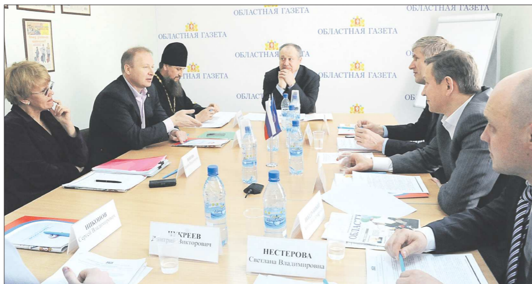
Обсуждение ужесточения правил торговли алкоголем, которое прошло в «ОГ», стало самым представительным

Федеральное законодательство о регулировании производства и оборота алкоголя даёт право регионам вводить в этой сфере собственные запреты. Областное правительство подготовило проект постановления «Об установлении на территории Свердловской области дополнительного ограничения времени, условий и мест розничной продажи алкогольной продукции». Этот документ обсудили участники «круглого стола», состоявшегося в редакции «Областной газеты».