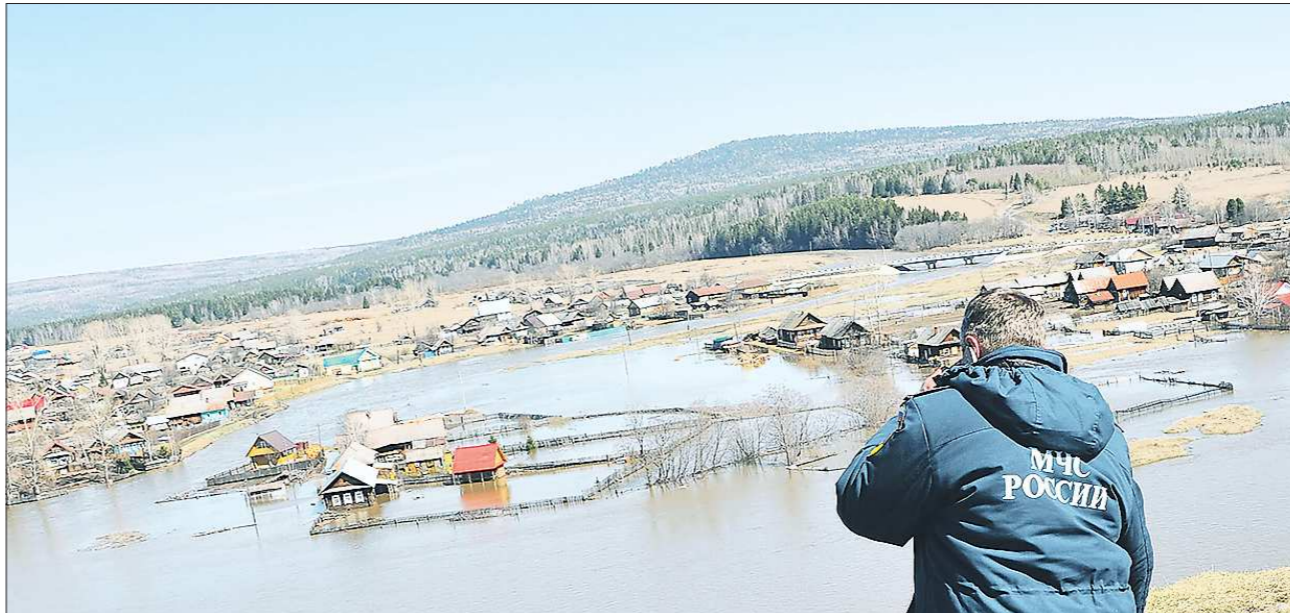
Вряд ли в нынешнем году подтопленные огороды Староуткинска дадут хороший урожай. (Больше фотографий — на сайте oblgazeta.ru)

Предыдущее серьёзное наводнение в этих краях было в 1979 году. Местные жители вспоминают, что тогда вода поднялась до самых окон домов, немало хозяйств пострадало. А вот последние вёсны в Староуткинске проходили спокойно, да и нынешнее наводнение не ждали, хотя на всякий случай были готовы. Ещё 22 апреля людей предупредили о возможном ЧП. Таяние снега и обильные осадки стали причиной беды. 4 мая из-за резкого подъёма воды деревянная часть спускового лотка плотины на Дикой Утке не выдержала и разрушилась, в нижней части реки произошёл затор и