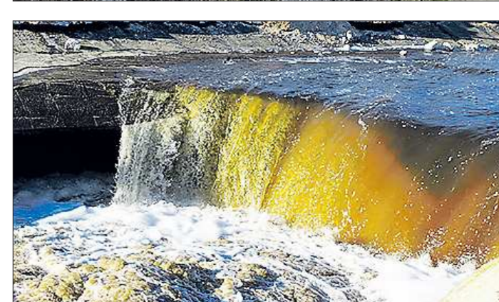
Провал в русле Ваграна образовался в минувшие выходные. На территории Североуральского городского округа около 73 км рек и ручьёв забраны в бетонные берега. Это сделано для того, чтобы предотвратить попадание воды в подземные выработки шахт

ГОСУДАРСТВЕННОЕ БЮДЖЕТНОЕ УЧРЕЖДЕНИЕ СВЕРДЛОВСКОЙ ОБЛАСТИ «РЕДАКЦИЯ ГАЗЕТЫ "ОБЛАСТНАЯ ГАЗЕТА"». ОБЩЕСТВЕННО-ПОЛИТИЧЕСКОЕ ИЗДАНИЕ