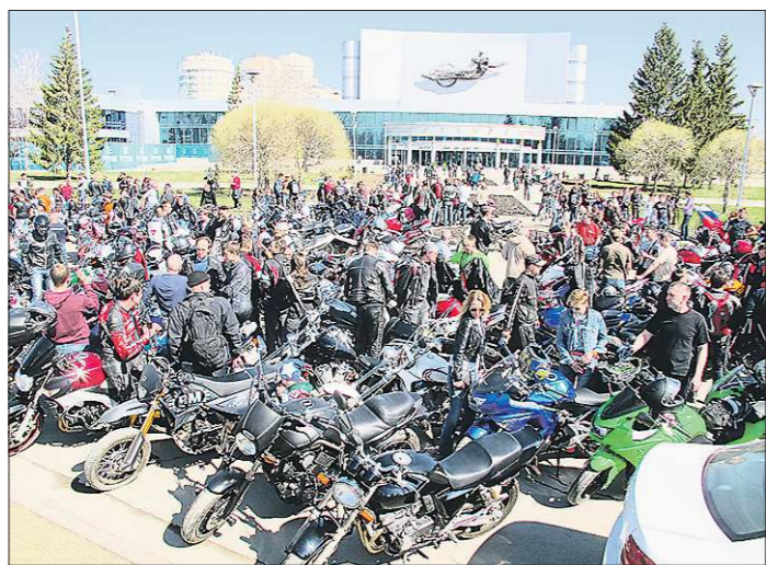
Буквально за полчаса площадка около ККТ «Космос» превратилась в огромную стоянку для мотоциклов