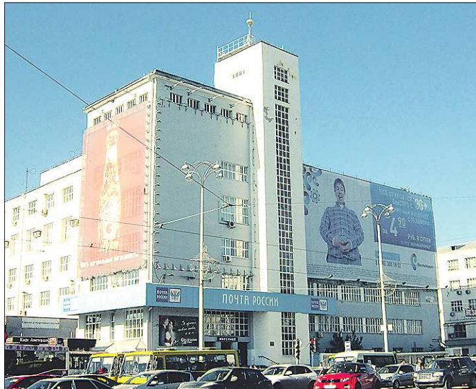
Здания в стиле конструктивизма в нашем городе — предмет особой гордости. Изображение Главпочтамта, к примеру, любил размещать на открытках (на фото справа — 1972 год). Но в последние годы здание больше напоминало не памятник архитектуры, а стэнд для рекламы... Сегодня его фасадами снова можно любоваться

— У вас — недели не проходит, у нас — дня. Вот стоял дом. Или сарай. Никому не был нужен. Его начали сносить, и вдруг появляется общественник, который прибегают и кричит, чтобы мы срочно прекратили снос объекта культурного наследия. Сенсация, скан-