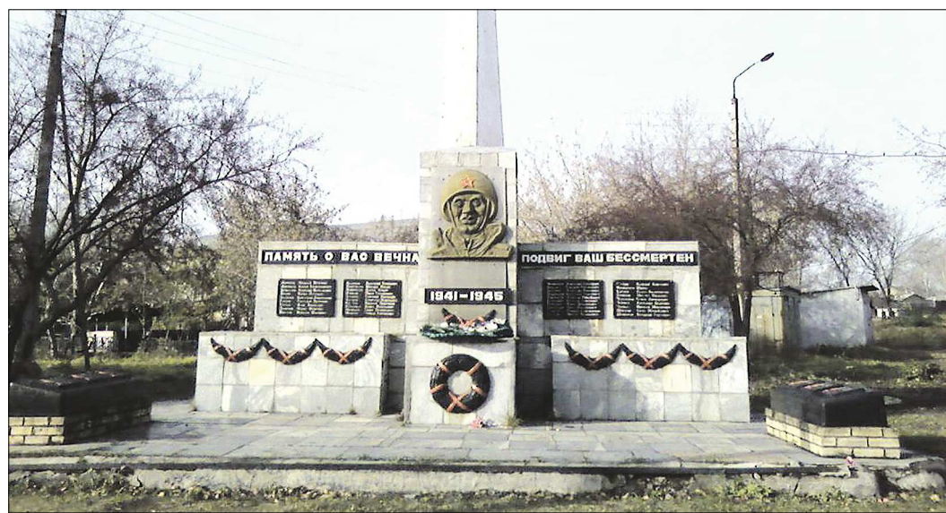
Мемориал, посвящённый подвигу алапаевцев в годы войны, поддерживается горожанами в хорошем состоянии

Многоэтапный план Совета ветеранов, воинских частей и предприятия по военно-патриотическому воспитанию допризывников конечной целью имеет возвращение молодых ребят, в Титановую Магнитку, которой нужны молодые рабочие руки.