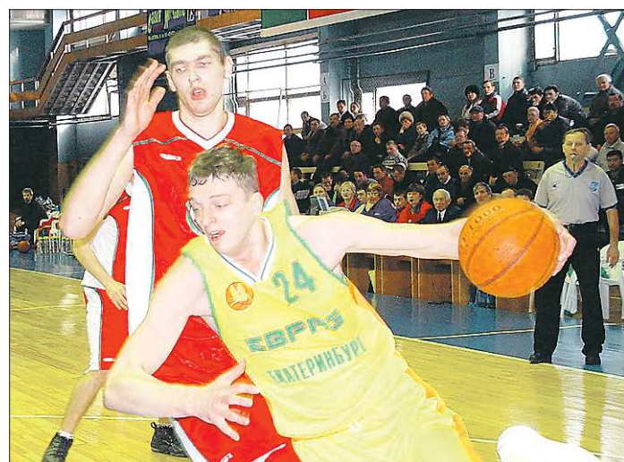
Лучший в истории мужского свердловского баскетбола результат принадлежит команде «ЕВРАЗ»