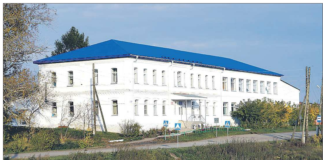
В школе села Деево учатся 166 учеников, в том числе из соседних сёл — Раскатики, Гостьково, Молтаво, Маёвки

Надежды на то, что на месте рытвин и колдобин скоро ляжет асфальт или хотя бы доброе щебеночное покрытие, увя, вежливо. Как ответили нам в областном Управлении автомобильных дорог, «возможно, эти работы будут выполнены в будущем при наличии финансирования, но в этом году они не запланированы».