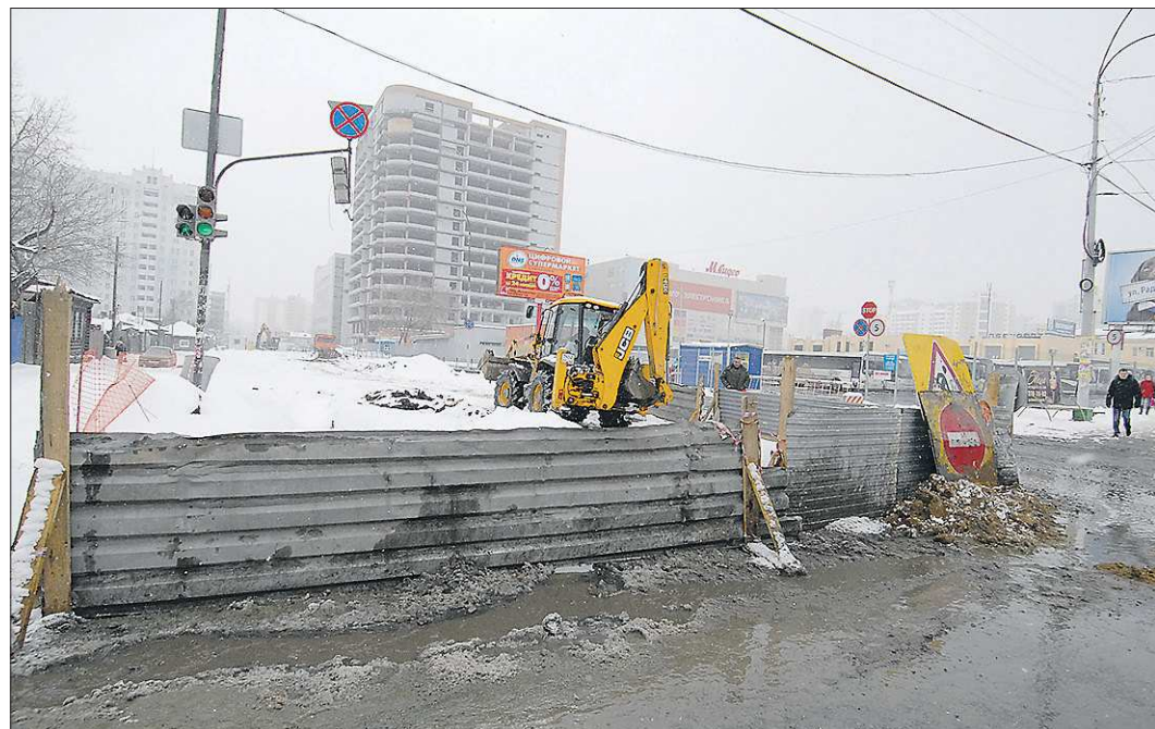
Реконструкцию улицы Степана Разина по программе «Столица» должны были закончить ещё в прошлом году, но подрядчик сорвал сроки