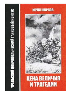
Этот альманах рассказывает об алапаевцах, бойцах Уральского добровольческого танкового корпуса