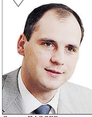
Денис ПАСЛЕР, председатель правительства Свердловской области