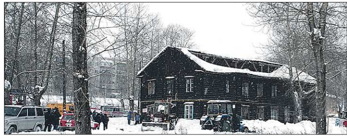
Кровля не выдержала веса снега и порыва трубы отопления на чердаке. Барак 1935 года постройки наконец-то решено снести

Чем дороже проезд в столице Среднего Урала, тем реже стараются ездить пассажиры. Желание транспортных предприятий увеличить доход может дать обратный результат