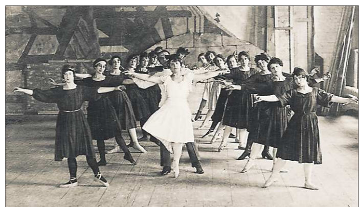
Балетная труппа. 1922 год

труппа достигла к концу 80-х годов XX века. Вся балетмейстерская элита Советского Союза ставила здесь — Игорь Бельский, Олег Виноградов, Юрий Григорович... Их постановки шли очень долго, а некоторые идут и до сих пор. Это было самое золотое время не только балетной труппы, но и театра вообще. После развала страны труппа развалилась тоже.