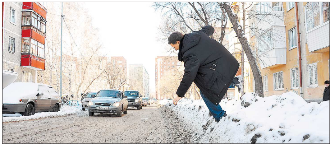
В попытках преодолеть сугробы екатеринбуржцам приходится бить рекорды

А может быть, проблему можно решить за счёт элементарных мероприятий по снижению себестоимости перевозки? Или начать всерьёз бороться с пробками? Ведь и из-за них транспортные предприятия теряют доходы.