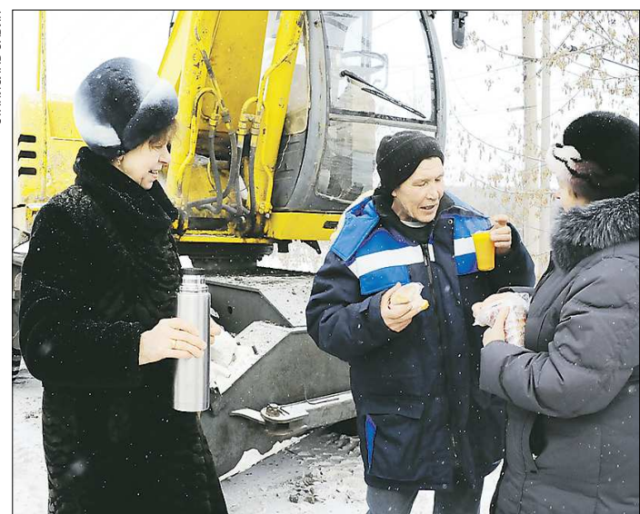
Жители Сухого Лога привозят еду и горячие напитки бригадам ремонтников, которые практически в круглосуточном режиме занимаются восстановлением водовода