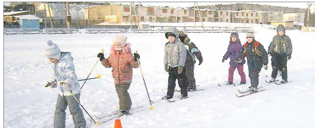
Пока в очереди за путёвкой стоят 18 верхнетагильских семей. Однако в последнее время город переживает бэби-бум, значит, новый садик в 19-м квартале пустовать не будет

Записали Алевтина ТРЫНОВА, Дмитрий СИВКОВ