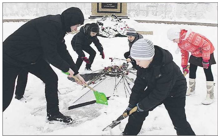
Уборка мемориалов от снега стала делом привычным школьников делом привычным