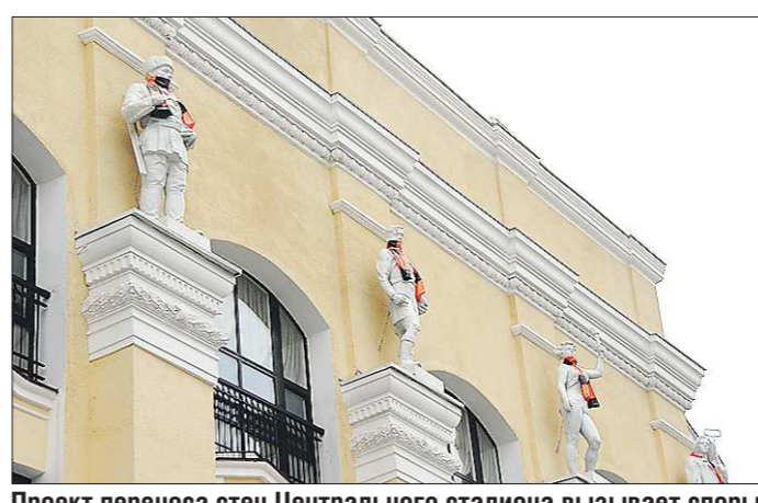
Проект переноса стен Центрального стадиона вызывает споры