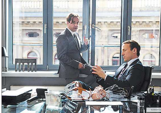
КДК из фильма

• Режиссёр хотел снять не просто комедию для развлечения, но и затронуть ряд социальных проблем. Например, судьбу бездомных животных и последствия развода для детей.