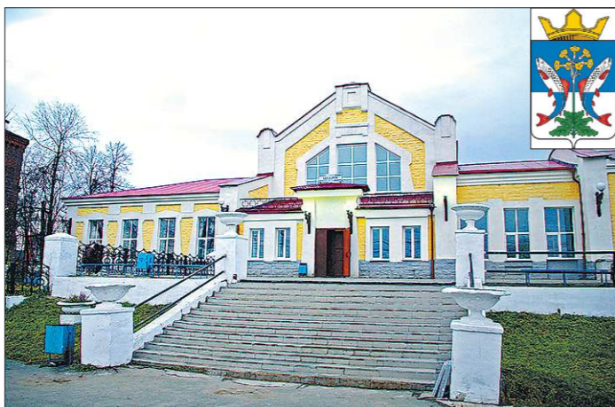
Вокзал уральской Шали

Кстати, городской сайт Шали читать интересно даже на словацком — многие слова знакомы. Навигация лёгкая, поэтому краткий обзор занял совсем немного времени. Ну, и чем живёт наш «тезка»? Оказывается, и тамшние депутаты порой пренебрегают своими обязанностями. Об этом свидетельствует объявление о переносе заседания горсовета, назначенного на 24 июля. Оно отложено на 30 июля — в связи с от-