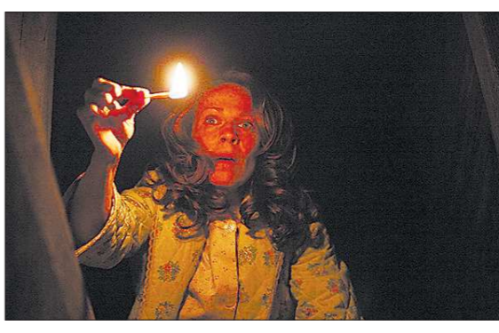
КДК из фильма