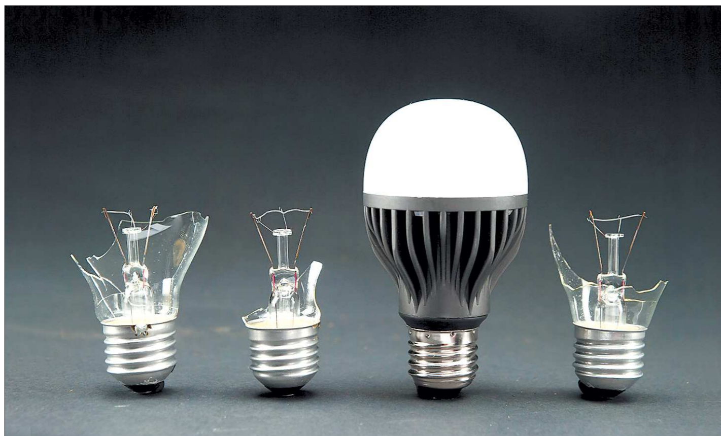
Светодиодная лампа мощностью 3,7 Вт светит как лампочка накаливания мощностью 75 Вт

Самый высокий уровень пенсий у испанцев, американцев, шведов, финнов, австрийцев и немцев – от 2200 до 2900 долларов. Самый низкий – в России и Украине – на уровне 340 долларов. За прошедшее десятилетие в Европе возросло количество работников, возраст которых превышает 55 лет. Эта тенденция характерна для всех 27 стран ЕС, кроме Португалии и Румынии, и продолжает набирать обороты.