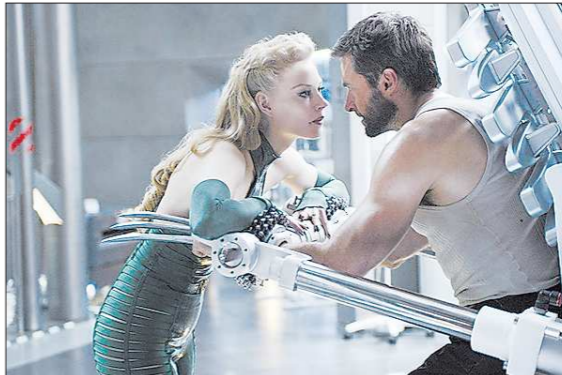
КДК из фильма