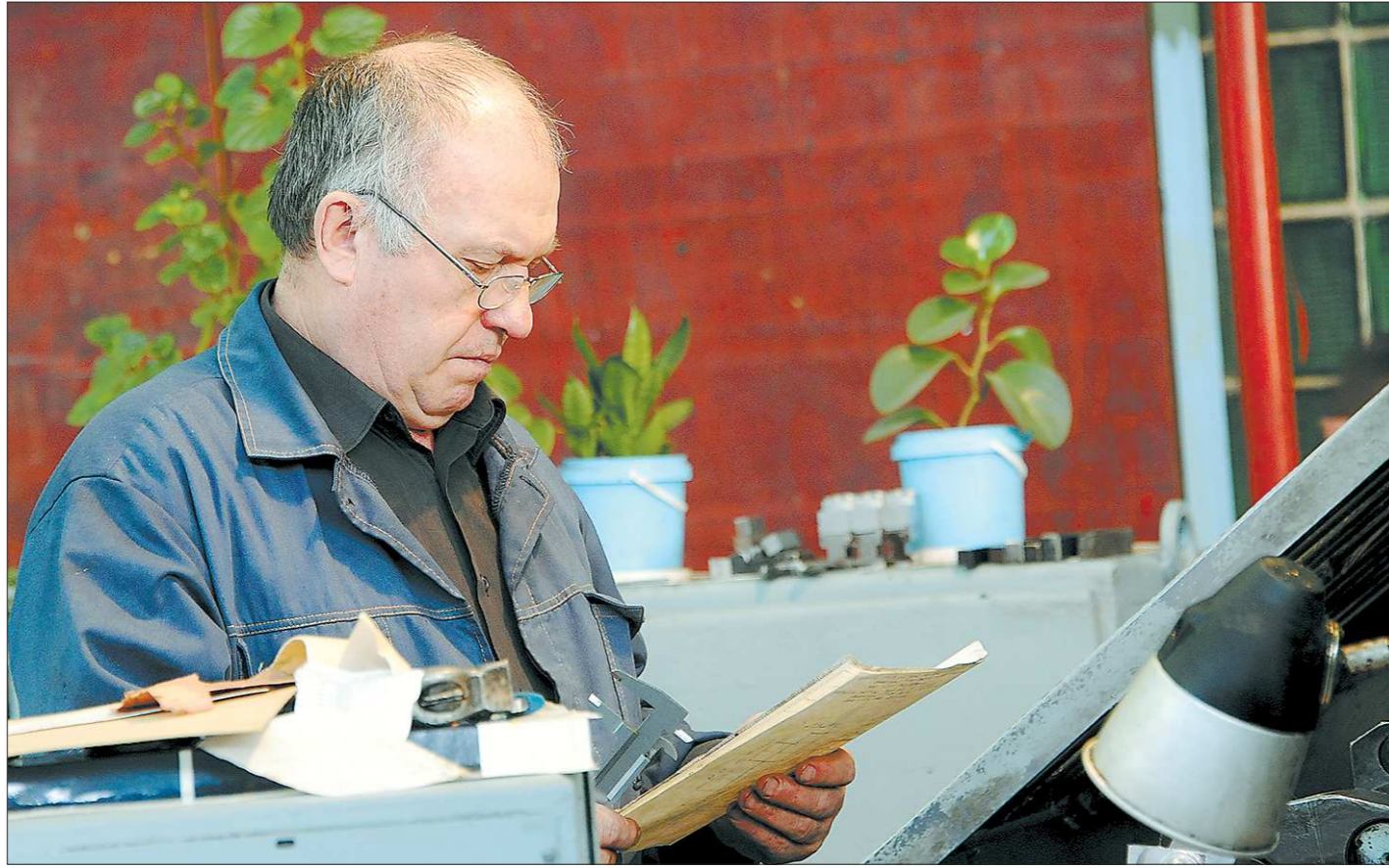
Специалистов рабочих профессий на любом предприятии «оторвут» с руками, и пенсионный возраст работодателей не отпугивает

«Как педагог я ушла на пенсию в 50 лет. Устроилась специалистом по кадрам. Зар-