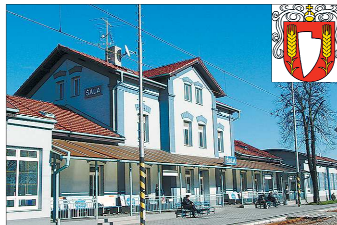
Вокзал словацкой Шали