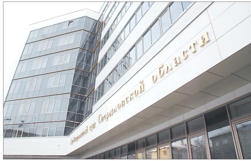
Узнав о возможности обжаловать завышенную кадастровую стоимость земельного участка, собственники земли стали массово обращаться в Арбитражный суд