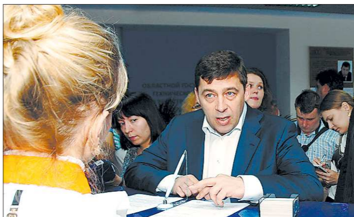
Губернатор Свердловской области Евгений Куйвашев лично проверил работу фронт-офиса, где принимаются заявления уральцев по поводу бесплатного выделения земли

— У нас сегодня в очереди на предоставление земельных