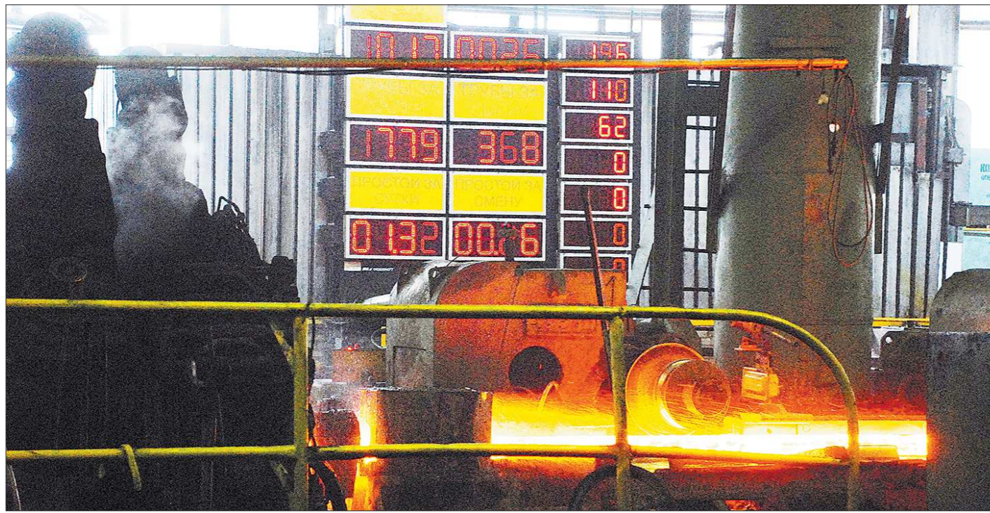
Создание одного рабочего места в базовых индустриальных отраслях даёт в среднем 2,5 рабочих места в смежных непромышленных секторах экономики

— Что новое, что модернизированные рабочие места — это новые технологии и оборудование. Очень важно, чтобы средние и высшие образовательные заведения готовили специалистов, способных в этой технике разбираться, работать на ней и обслуживать её. Поскольку мы при создании рабочих мест по сути обучаем заново тех специалистов, которые у нас работают либо которые к нам приходят, то мы тратим на это достаточно серьёзные средства и создаём общественное благо. К сожалению, система профессионального образования не успевает за теми темпами модернизации, которые осуществляются компаниями. Мы вынуждены этим