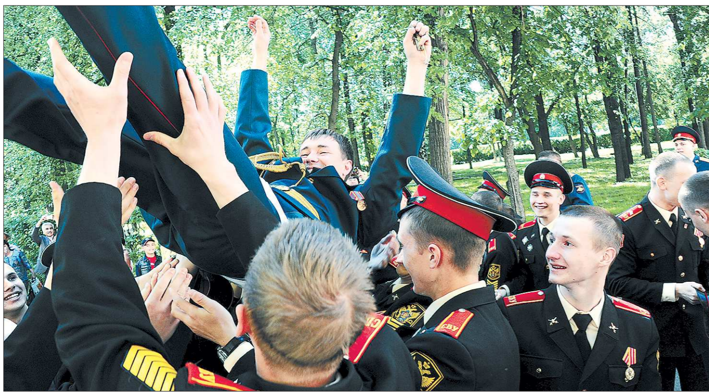
За 70 лет своей работы Екатеринбургское суворовское училище выдало путёвку в жизнь 16 тысячам воспитанников