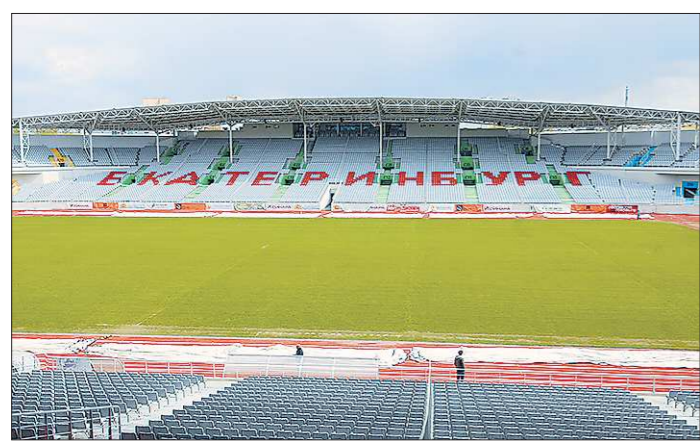
Скоро здесь опять будут хозяйничать строители