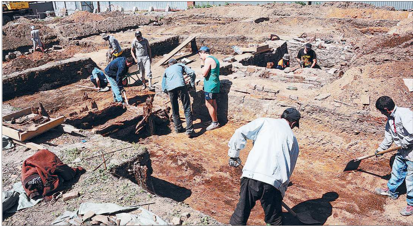
Место на перекрёстке улиц Гоголя-Энгельса, где сейчас ведут раскопки, раньше называлась Банная слобода. Местная речка Малаховка постоянно заливала улицы, поэтому одна из них получила название Грязнухиная (потом стала Разгуляевской), а с 1909 года — Гоголевской)