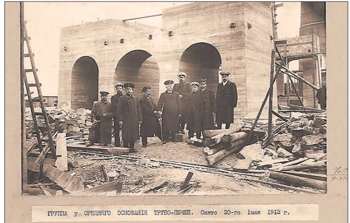
Спустя месяц после начала возведения завода. Позже здесь построили бондарный цех: в нём изготавливали деревянные бочки, в которые упаковывали цемент. Грузёная бочка весила 155 кг

18 июня 1913 года неподалёку от Невьянска был заложен цементный завод, и эти же дни здесь был основан посёлок. Развитие завода и поселения шло параллельно, разговоры о том, что было вначале — яйцо или курица — явно неуместны. Местным жителям эти вопросы кажутся странными — при чём тут приоритеты, если и посёлку без завода никуда, и работа завода без посёлка встанет. Так повелось столетие назад — так идёт и поныне.