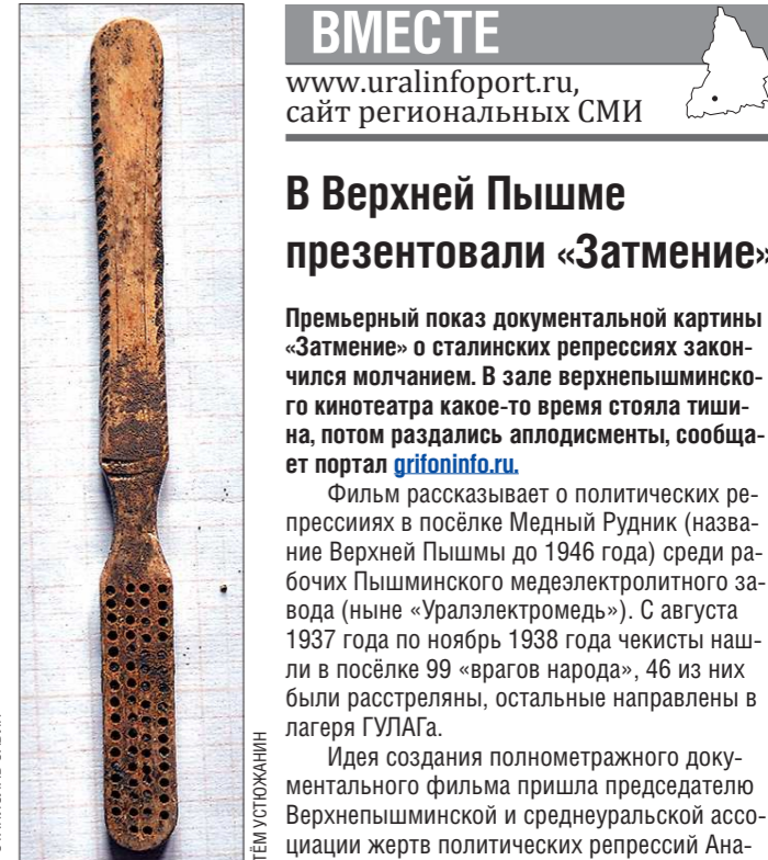
Эту щётку нашли при раскопках в Екатеринбурге. А вообще первые зубные щётки в России (конец XVII — начало XVIII) были костяными, изготавливали их мастера-ювелиры. От щёток требовалось, чтобы она охватывала сразу много зубов и не теряла щетины