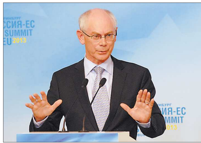
Херман ван Ромпёй: «Екатеринбург является символом евразийского измерения нашего сотрудничества»