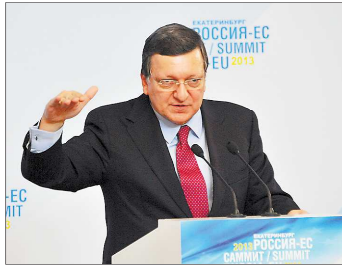
Жозе-Мануэль Баррозу: «Урал уже стал не границей, а мостом между Европой и Азией»

«Хотел бы поблагодарить руководство и членов Евросоюза за поддержку Екатеринбурга в качестве столицы Всемирной универсальной выставки», — сказал Владимир Путин.