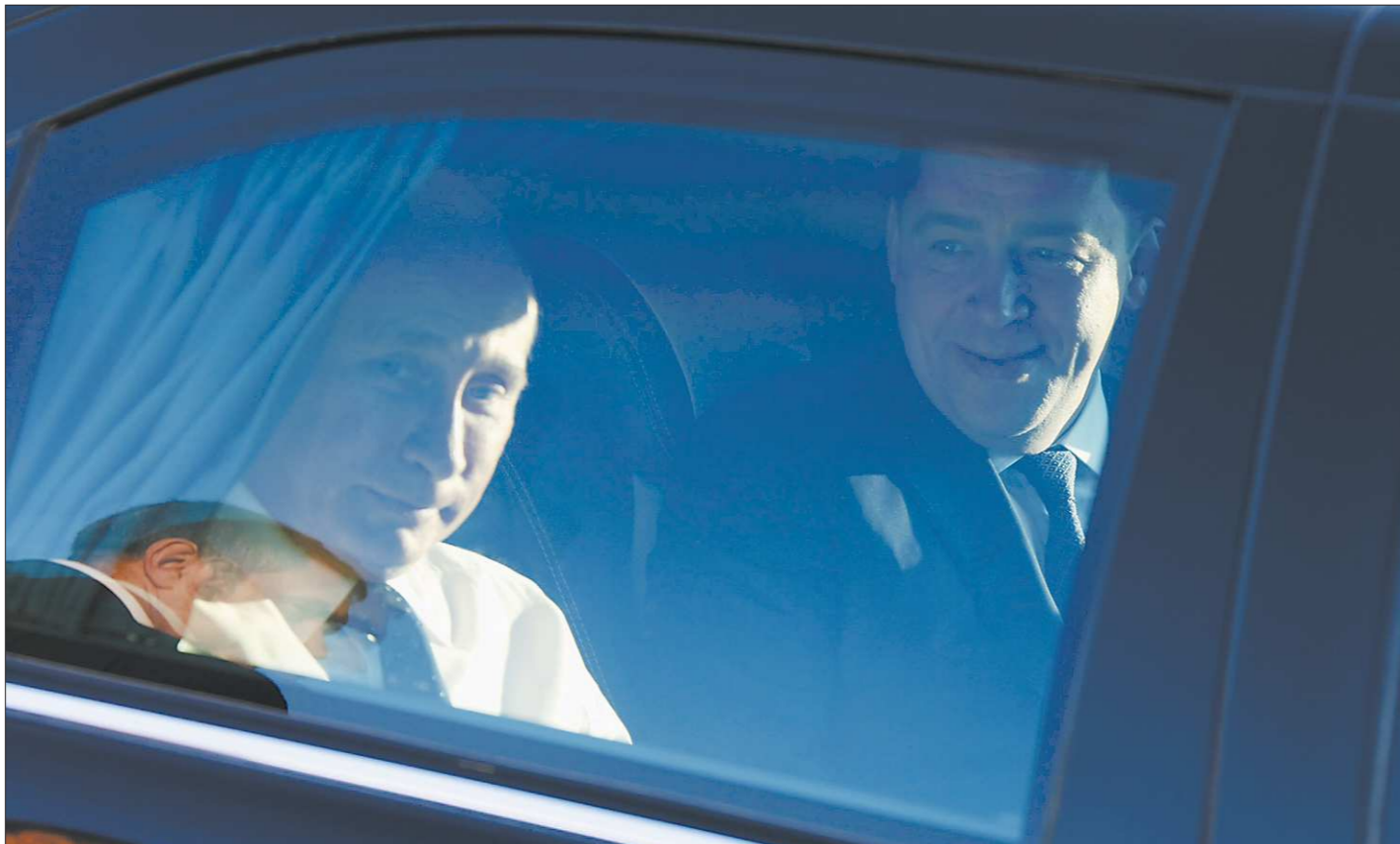
Прибывшего вечером 3 июня в Екатеринбург Президента РФ Владимира Путина в международном аэропорту Кольцово встретил губернатор Свердловской области Евгений Куйвашев. К месту встречи с руководителями Евросоюза они отправились в одном автомобиле

Открывая пленарное заседание официальной встречи Россия — ЕС, Президент РФ Владимир Путин отметил, что Екатеринбург — это город с богатыми культурными и историческими традициями, который является претендентом на проведение Всемирной универсальной выставки ЭКСПО в 2020 году. А председателем Европейского совета Херман ван Ромпёй, поблагодарив руководство Свердловской области за оказанное гостеприимство, подчеркнул, что для проведения саммита выбран «потрясающий город, который сегодня является символом евразийского сотрудничества». Его поддержал и председатель Еврокомиссии Жозе-Мануэль Баррозу, отметивший, что «Уральские