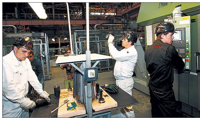
Объемы промышленного производства будут прирастать в среднем на 5,7 процента в год