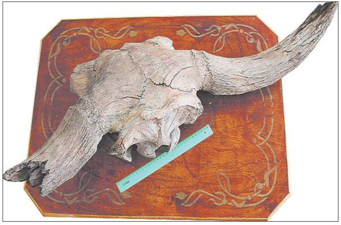
Буйвол «прекрасно сохранился», несмотря на возраст

А привёз научным сотрудникам камышловского музея, чтобы подтвердить свои догадки: фрагмент черепа — останки доисторического животного. Но, когда увидел замечательную экспозицию зала природы, решил найденное оставить в музее. Сотрудники Камышловского краеведческого музея убеждены: экспонат ценен тем, что во фрагменте сохранились шейные позвонки. Это даёт представление как о строении шейного отдела позвоночника, так и о гигантских размерах древнего животного. Высота фрагмента черепа — 20 сантиметров, ширина — 33 сантиметра, расстояние между остатками рогов — 94 сантиметра. При этом остаток правого рога — 37 сантиметров, левого — 24 сантиметра. Как считают палеонтологи, возраст вымершего животного может варьироваться в пределах от нескольких десятков тысяч до сотен тысяч лет. Кстати, такие находки для Пышминского района не редкость: давним-давно здесь были стоянки первобытных