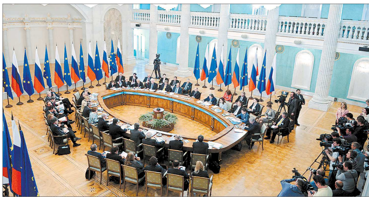
Пленарное заседание саммита прошло в доме Севастьянова. Здесь определяли будущее российско-европейских взаимоотношений