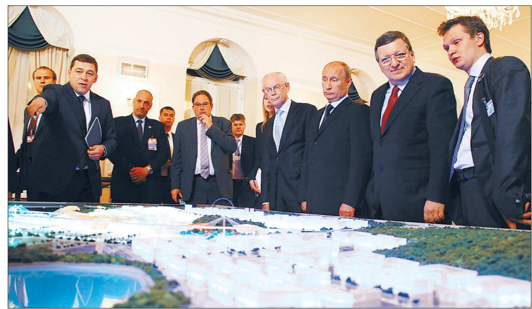
Презентация стенда екатеринбургского ЭКСПО-парка произвела впечатление на европейских гостей

Но в этом нет ничего особенного и необычного. Допустим, с 1995 года проводится расследование ограничения на допуск наших минеральных удобрений на европейский рынок. Мы вступили в ВТО – результата по этой линии нет... Сегодня с коллегами говорили об этом. Как было ограничение, так и есть. Но мы знаем и о встречных претензиях. И, честно говоря, мне стыдно, что мы, российская сторона, некоторые вещи до сих пор не решили.