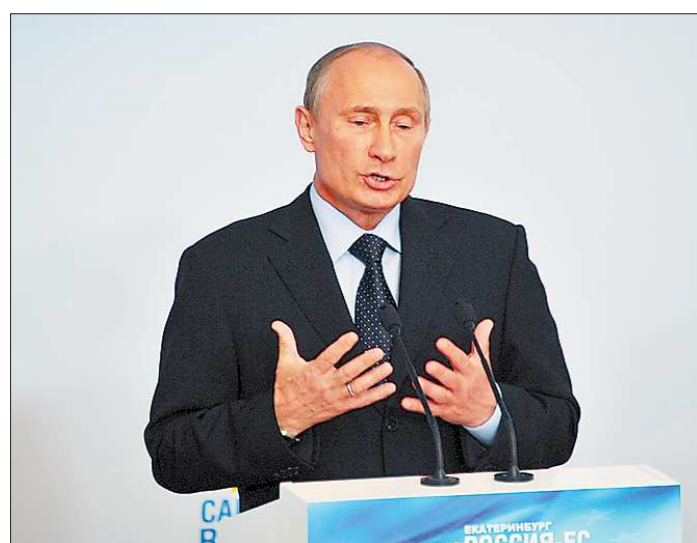
Владимир Путин: «Россия и Евросоюз — близкие партнёры»

Журналистам рассказали об итогах встречи на высшем уровне Россия – Европейский союз