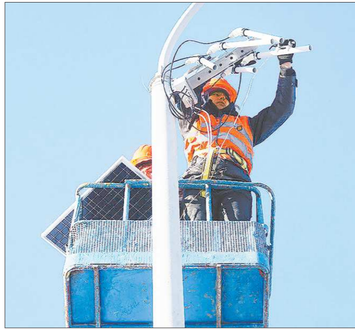
Как только рабочие закончат монтировать датчики на столбах, специалисты «встроят» их в адаптированную систему управления

Директор «Потока» таким решением не согласен. Он уверяет, что дойдет до президента — ведь тот сам неоднократно говорил, что рост цен на коммунальные услуги необходимо сдерживать. Однако его конкурент, который, кстати, и написал заявление в прокуратуру, убежден, что закон обойти не удастся, какая бы польза жителям от этого ни была.