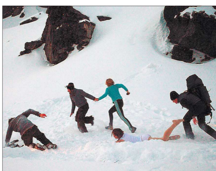
Пятеро американских студентов идут по следам трагически погибшей группы Дятлова — таков сюжет фильма Ренни Харлина. Картина вышла в российский прокат вчера. Мнение об увиденном корреспондента «Областной газеты» —

ва к концу июля. По прогнозам стоимость собственно мостового строительства оценивается в 1 миллиард 740 миллионов рублей. Чтобы понять, насколько эта цифра масштабна, достаточно сказать, что весь годовой бюджет Каменска-Уральского сейчас — около трёх с половиной миллиардов. Очевидно, что финансирование будет осуществляться из разных источников, в том числе из областного бюджета, который уже выделил средства на проектные работы. По оптимистичным оценкам, мост может быть сооружён за год и семь месяцев с момента начала строительства.