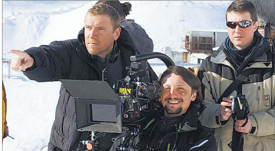
Пятеро американских студентов идут по следам трагически погибшей группы Дятлова — таков сюжет фильма Ренни Харлина (на снимке слева)