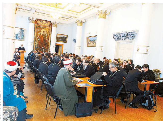
В Окружном доме офицеров, помимо штатных священников Центрального, Южного, Западного и Восточного военных округов, совещались и представители православного, мусульманского и буддистского духовенства, работающие в воинских частях на добровольной основе

Жалованье штатных священников в армии пока не-