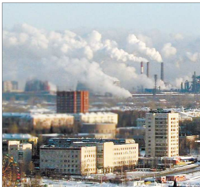
В безветренную погоду шлейфы дымов от заводских труб стелются по жилым кварталам

Однако в дни с неблагоприятными метеорологическими условиями вредные вещества не рассеиваются, скапливаясь в городской зоне. Дней таких немало: в 2011 году — 51, в прошлом — уже 114. Начавшийся год также отменился плохими метеорологическими условиями. Особенно «ядовитым» оказался февраль: город по несколько дней кутался в клубы смога.