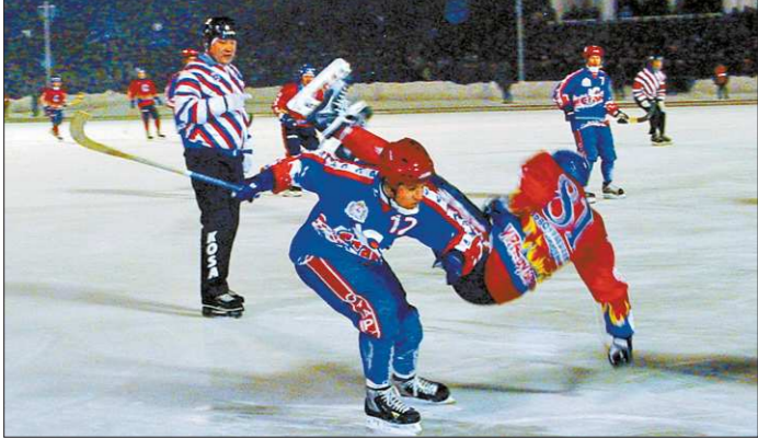
Хоккеисты «Старта» (в синем) отбросили первоуральцев на последнее место