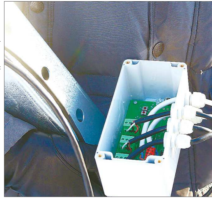
Как только рабочие закончат монтировать датчики на столбах, специалисты «встроят» их в адаптированную систему управления

Как рассказал Е. Селетков, сейчас все светофоры Екатеринбурга включены в единую автоматическую систему управления дорожного движения (АСУДД). Она функционирует по специальной программе, параметры которой заданы спе-