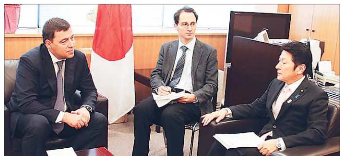
Губернатор Евгений Куйвашев и первый заместитель министра иностранных дел Японии Масадзи Мацуяма обсуждают возможность открытия на Урале дипломатического представительства Японии