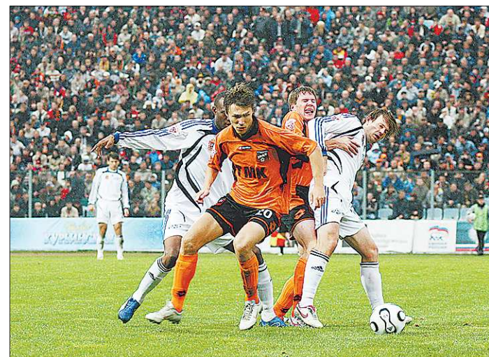
Своего наивысшего за 10 лет успеха «Урал» добился в 2007 году, когда, обыграв на переполненном стадионе «Уралмаш» раменский «Сатурн», вышел в полуфинал Кубка России

«Если сравнивать тогдашнее и нынешнее положение дел — это две большие разни-