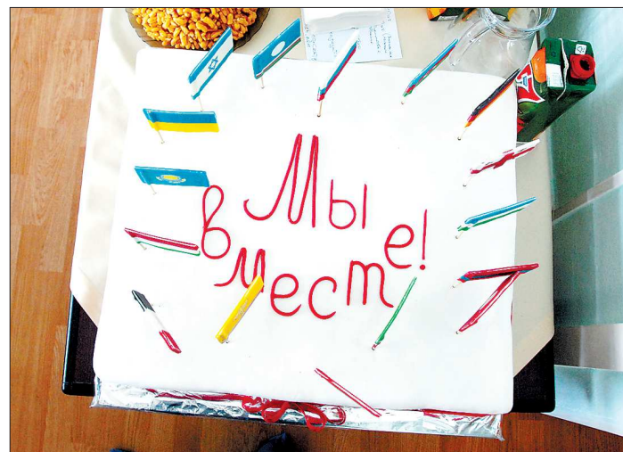
Этим необычным тортом угощали вчера гостей Дома народов Урала

Ничто так не разъединяет, как незнание. И ничто так