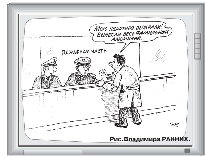
Рис. Владимира РАННИХ.