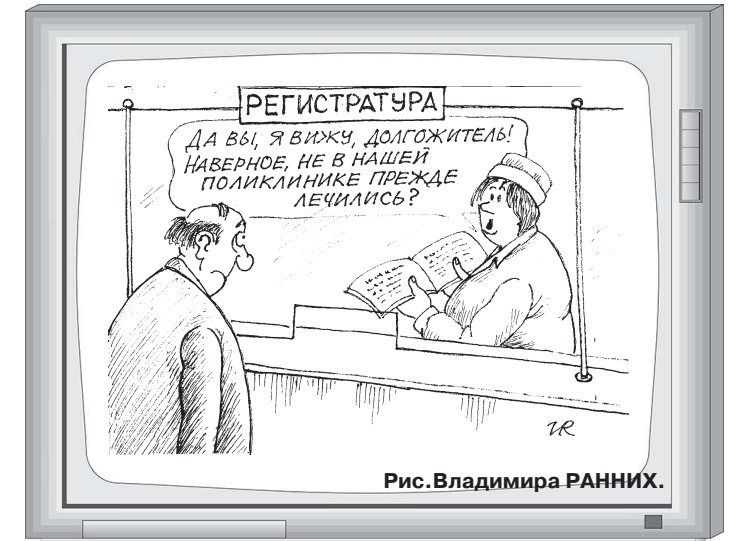
Рис. Владимира РАНИНС.