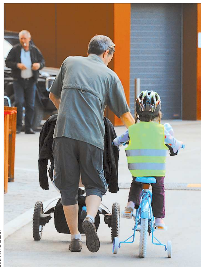
ГАИ-ГИБДД решила бороться с детским травматизмом на дорогах, наказывая безответственных взрослых

январь 2013 года жилищный фонд в городах области газифицирован на 62,8 процента, а в сельской местности — только на 15,8 процента. В этом году на газификацию выделяется более 2 миллиардов рублей, что позволит ввести в эксплуатацию 500 километров газопроводных сетей и 12 газовых котельных, газифицировать восемь населённых пунктов. Но до 2020 года поставлена задача дать голубое топливо в дома жителей ещё более тысячи посёлков, сёл и деревень, а количество газифицированных жилищ увеличить до полутора миллионов. В настоящее время в регионе обеспечены газом около одного миллиона жилищ.