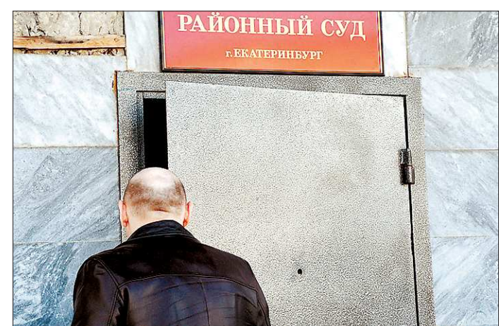
По результатам проверок Счётной палаты РФ в 2012 году возбуждено 176 административных и уголовных дел