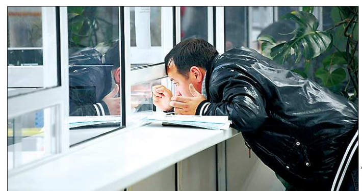
«Одно окно», а сколько проблем решает сразу!

Он попросил министра экономики в течение этого месяца сделать корректировку планов ввода филиалов многофункциональных центров по предоставлению госуслуг. Тем более что по поручению премьера регионального правительства количество пунктов предоставления услуг увеличивается в три раза — с восьми до 23. Все они нуждаются в ремонте разной степени сложности, а это требует денег, и времени.