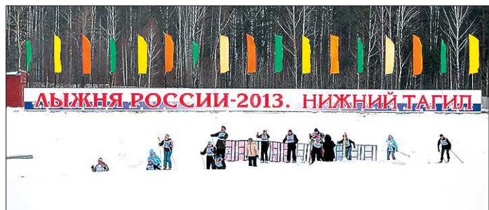
Трасса на полигоне «Старатель» не меняется уже несколько лет