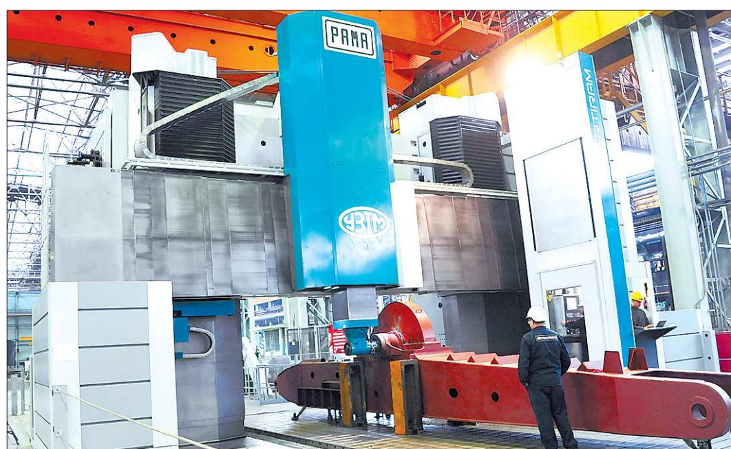
Новый станок позволит Уралмашзаводу набрать обширный портфель заказов