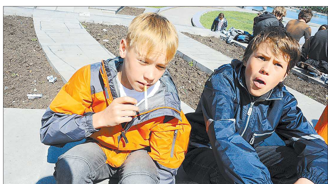
Свердловские медики с горечью констатируют, что сейчас курить дети начинают ещё в начальной школе

Напомним, что 15 февраля в результате воздушной ударной волны в Челябинской области было частично разрушено остекление в 4715 зданиях. 671 из них – это школы и детсады, 235 – больницы, 69 – учреждения культуры. Сейчас, по данным межведомственного оперативного штаба, восстановлено около 55 процентов пострадавших зданий.