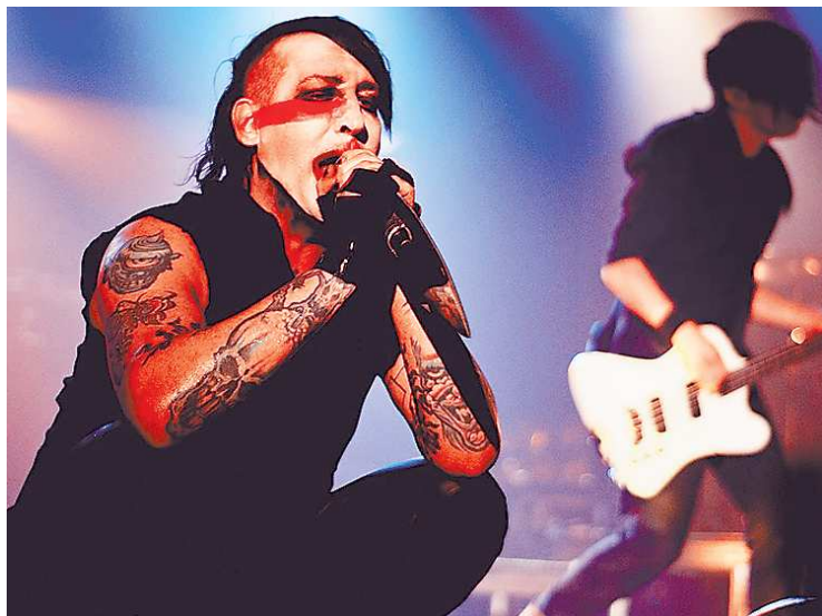
На концерте в Екатеринбурге Мэрилин Мэнсон остался верен своему сценическому образу.

На концерт Мэрилина Мэнсона выстроились такие длинные очереди зрителей, каких я не видела никогда. На представление съехались зрители не только из Екатеринбурга, но и со всей Свердловской области и даже из соседних областей. В среднем на морозе фанаты стояли больше получаса. Ситуацию особо не спасало даже то, что входов было несколько. В большинстве своём на концерт пришёл контингент 20+, хотя были как ребята младше, так и многим старше. Лично я заметила нескольких бабушек и дедушек!