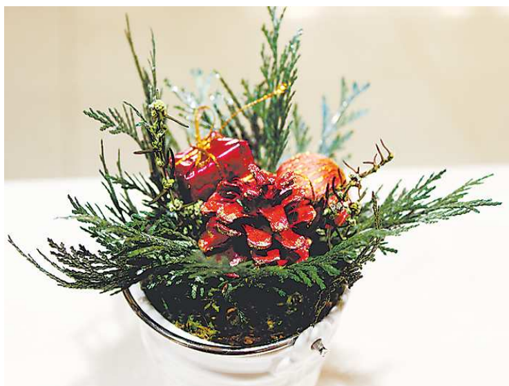
На снимках работы Елены Константиновой.