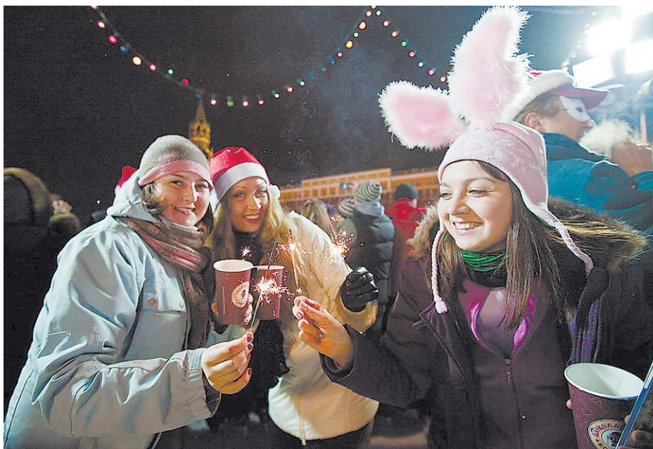
Не хочешь остаться в Новый год в одиночестве? Просто выйди на улицу.

Действительно, никто не может гарантировать, что компания соберётся тебе по вкусу. Скорее всего, если ты решишь присоединиться к людям на форуме, будешь иметь дело только с кем-то одним – тем, кто взял на себя руководство, а остальные в итоге станут для тебя полным сюрпризом. В таком случае даже не знаешь, что лучше