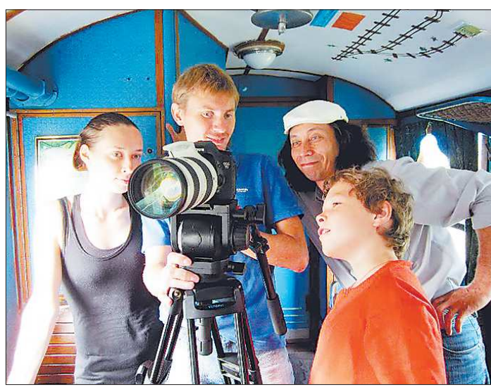
В процессе съёмки дети и взрослые работали на равных, учили друг друга

Как сообщила пресс-служба мэрии Екатеринбурга, особенностью бюджета-2013 является так называемое «одноканальное» финансирование сферы здравоохранения. То есть средства на развитие медучреждений будут направляться, главным образом, из Территориального фонда медицинского страхования. В будущем году планируется открыть стационар в детской городской больнице №5, продолжить ремонт поликлиники больницы №6.