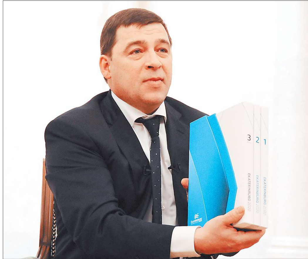
На встречу с журналистами губернатор принёс заявочную книгу Екатеринбургa на ЭКСПО-2020

На мой взгляд, мы неплохо поработали над разработ-