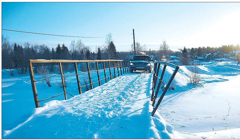
В качканарской администрации про этот мост говорят: «Его нет»

— Основным отличием бюджета следующего года будет серьёзное увеличение средств на городское развитие. Если брать бюджеты прошлых лет, то раньше мы тратили порядка 25 миллиардов на текущие расходы (зарплаты, содержание и так далее) и порядка четырёх миллиардов на развитие города. В 2013 году, с учётом программы «Столица», мы существенно увеличиваем расходы на развитие города, в частности, на дорожное строительство и ремонт. Это непростая задача, мы не можем остановить весь город, чтобы отремонтировать перекрёстки, поэтому будем решать вопрос комплексно.