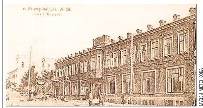
Станция телеграфа располагалась в одном здании с почтой. Первым её руководителем был назначен чиновник в чине поручика Департамента телеграфов