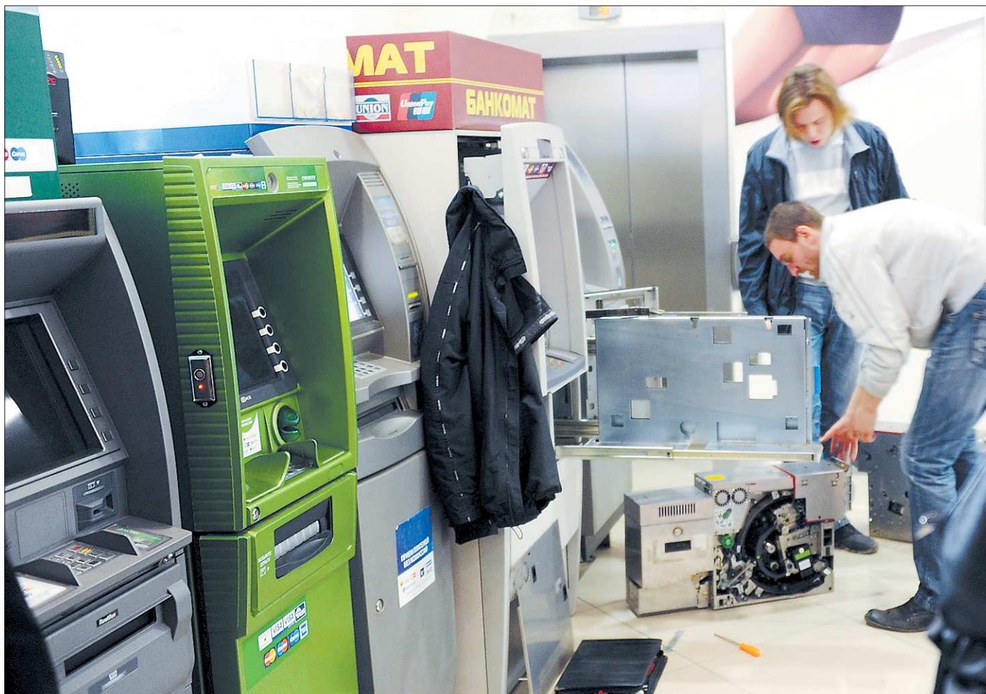
С банкоматами так работают только специалисты с допуском, жулики снимают с них деньги скрытно, стараясь не привлекать к себе внимания

— После рассмотрения большого количества предложений от трёх сторон социального партнёрства основные интересы наших жителей, а также наших предприятий и организаций, учтены, — оценил трёхстороннее соглашение подписавший его председатель областного правительства Денис Паслер.