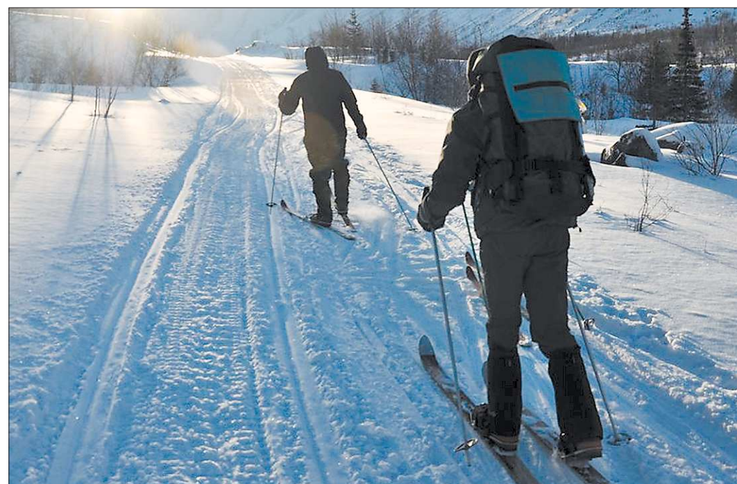
Речь Президента лыжники будут слушать в пути по радиоприёмнику. А вот во время звучания гимна, судя по всему, придётся на минуту остановиться!