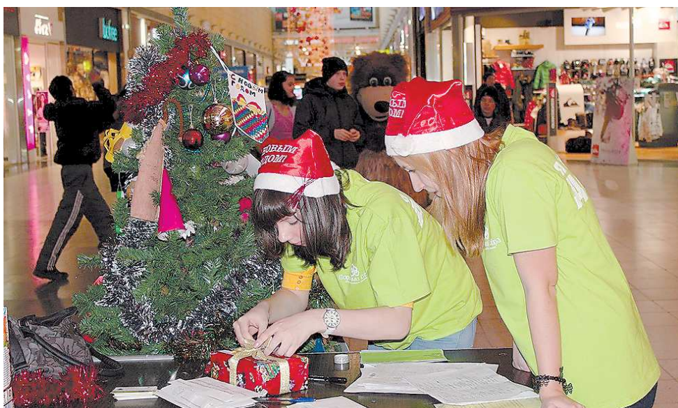
Школьники и студенты собирают подарки для детей из детских домов на акции «Ёлка желаний». Они только часть большой волонтерской команды, в которой много людей старше и опытнее.

– Если у тебя есть один-два часа свободного времени, вместо того, чтобы шататься