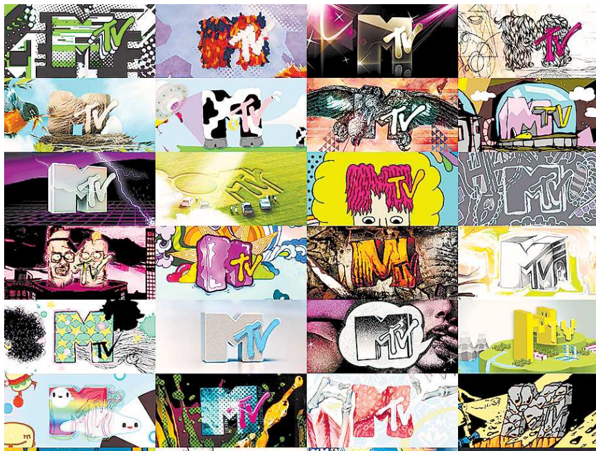
MTV был таким разным. Это и привлекало молодых зрителей.

В последнее время музыкальные каналы становятся всё менее интересными. Если раньше о выходе нового альбома у любимой группы узнавали совершенно случайно и