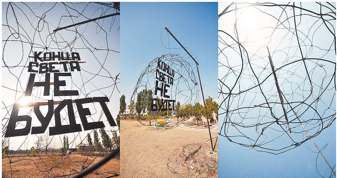
Конец света вызвал такой ажиотаж, что этому событию даже стали посвящать уличные скульптуры. Ту, что на фото, можно увидеть в Одессе.

–Нет. Кому-то эта фантазия пришла в голову, и все теперь вынуждены отдуваться, объяснять, что конца света не будет. У людей хорошо работает фантазия. Придумана тысяча и одна версия конца света. Но это только выдумка. Давать на всякие выдумки научный ответ просто невозможно.