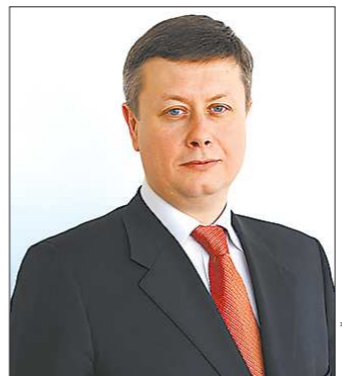
Депутат Серебрянников убеждён: убыточные междугородние маршруты в принципе. А скоро не будет и незаконных

2006 годах отказалось от тридцати маршрутов. Очевидно, паспорта были проданы руководством Сысертского АТП, официально — передали по агентским договорам. Причина банальна — деньги. Это, увы, недоказуемо, хотя я знаю эту информацию. Отказы оформлялись заявлениями в министерство, и по этим заявлениям минпром принимало решения, а позднее выдавало паспорта маршрутов другим компаниям. Правда, в министерстве «отказаны» паспорта оказались не исключёнными из реестра. И возникла ситуация, которая не должна быть вообще: на одном и том же маршруте стали работать по два три перевозчика. Это спровоцировало дику конкуренцию, когда на дороги выехали нанятые одним перевозчиком бандинты и запугивали водителей конкурирующих компаний. Эти методы в Арамиле и в Екатеринбург (на территории Южного автовокзала) применяло, по моему мнению, МУП «Сысертское АТП».