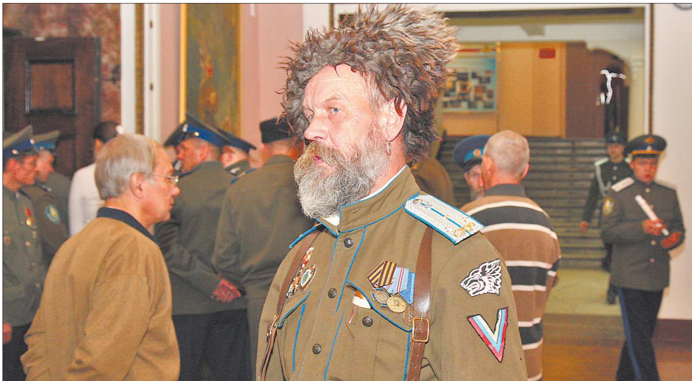
К охране общественного порядка атаманы привлекают казаков, имеющих многолетний опыт службы в армии и правоохранительных органах

Нет. Когда мы говорим «казачки без веры не казаки», конечно, в первую очередь подразумеваем православие христианство, к которому относят себя 80 процентов населения нашей страны. Но мы понимаем, что живём в многонациональной, многоконфессиональной стране. Мы помним, что башкирские и татарские подразделения, например, активно воевали в составе уральских казачьих формирований в войне 1812 года, 200-летие которой мы сейчас отмечаем, и в других войнах. Сегодня у нас очень активно работают казачьи общества в Красноуральском городском округе, а там много населённых пунктов, где совместно проживают и русские, и татары, и башкиры, и представители других этнических групп. Я был у них на казачьем слёте, где рядом сидели и башкиры, и русские, и татары. И все они осознавали себя казаками. На всех наших мероприятиях, при проведении казачьих кругов обязательно присутствуют учителя священнослужители. Но