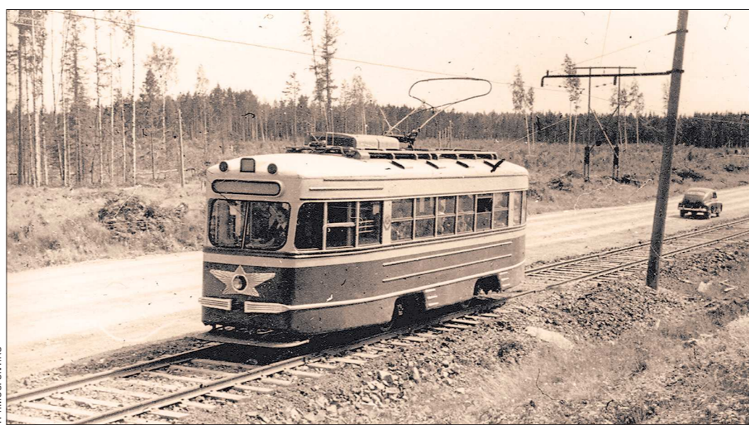
Трамвай КТМ-1 на междугородном маршруте Волчанск — Карпинск. Фото первой половины 60-х годов

1 >>> 1 В 1953—1965 годах существовал междугородный трамвайный маршрут, соединявший Карпинск и Волчанск. Трамвайная линия длиной 16 километров была целиком однопутной, с одним разъездом. Рельсы были проложены вдоль автомобильной дороги. Закрытие маршрута связано с курьёзом. В 1965 году линию разобрали, чтобы она не мешала перебороске по автодороге своим ходом огромного шагающего экскаватора из карпинского угольного карьера в волчанский карьер. Однако после того, как экскаватор прошёл свой путь, линию так и не восстановили.