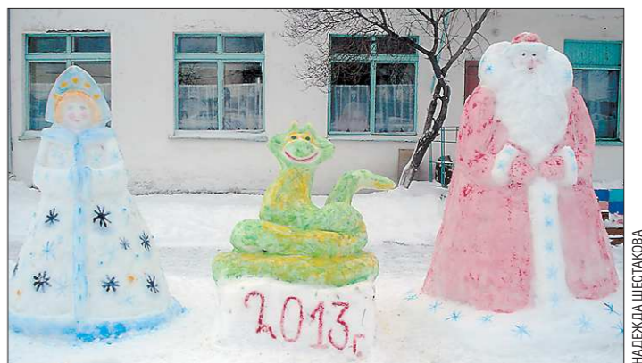
Снежные скульптуры поселились под окнами детского сада в Лобве