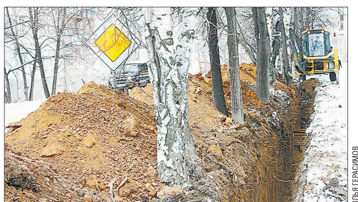
Выживут ли деревья с подрезанными корнями – большой вопрос

Горожане пытаются остановить работы по прокладке траншеи для газопровода, которые ведутся на одной из улиц в губительной близости от зелёных насаждений, пишет информационный сайт Верхней Пышмы и Среднеуральска govp.info .