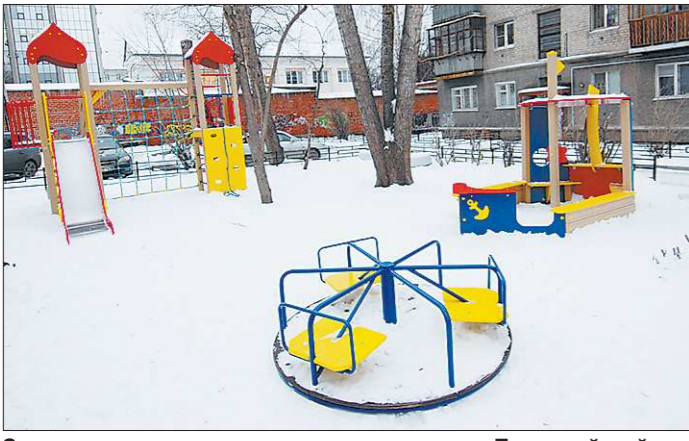
От подачи заявки до появления площадки на Первомайской, 108 прошло чуть больше полугодя. Установили новое оборудование за неделю