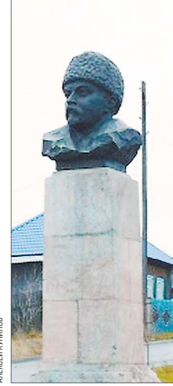
Памятник писателю в посёлке Висим

местном музее, чтобы поделиться свежими находками в изучении родного края. Самодеятельные артисты подготовили мини-спектакль на основе пьесы Мамина-Сибиряка «Золотопромышленники». Висимчане устроили большое торжество, в котором приняли участие жители посёлка и званые го-