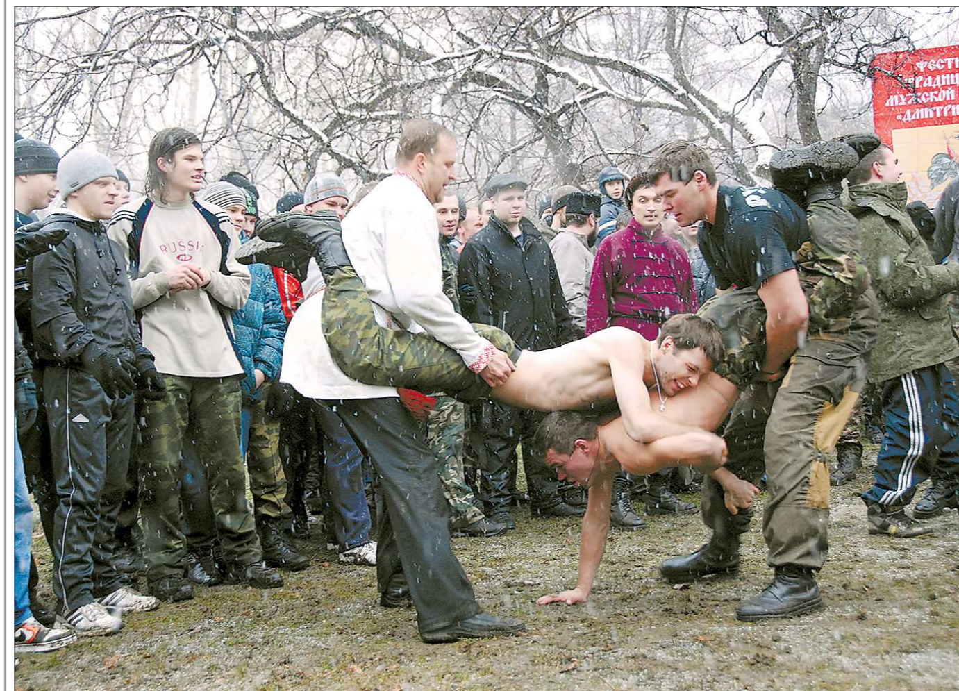
В минувшие выходные в Екатеринбурге отпраздновали Дмитриев день. На фестиваль русской мужской культуры собралось несколько сотен человек из разных уголков Свердловской области.