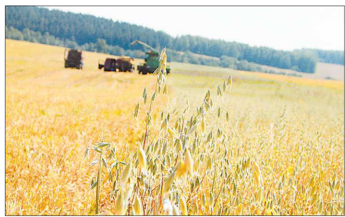
Как и летом 2010 года, нынешняя засуха прежде всего ударила по зерновым

ют в итоге, что урожайность картофеля в этом году выйдет на уровень 120–125 центнеров клубней с гектара. Учитывая, что вместе с огородами частников картофелем в области занято около 52 тысяч гектаров, урожай «второго хлеба» для нужд области должно хватить с избытком. И даже, как предполагают в областном аграрном ведомстве, около 30–40 тысяч тонн клубней хозяйства Среднего Урала смогут отправить в другие регионы, где эта культура пострадала от засухи.