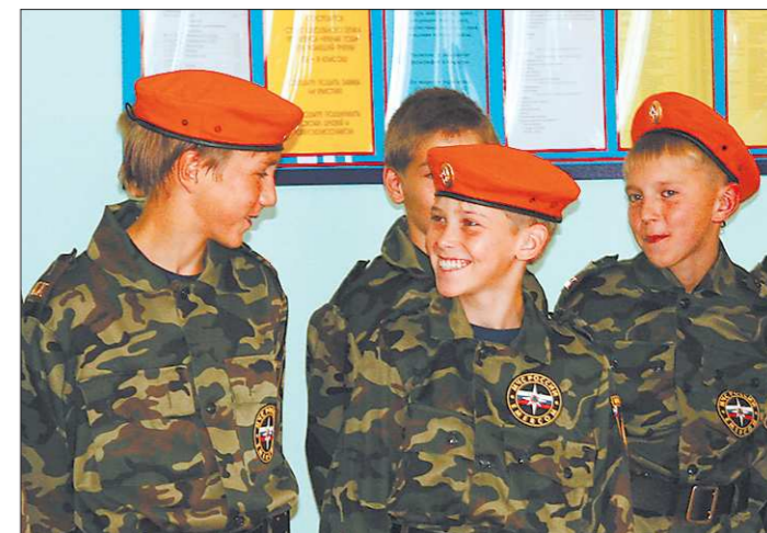
Очень рады стараться

В этом году в Серове появился первый кадетский класс МЧС — это 7-«К» класс школы № 20. На днях его учеников торжественно посвятили в кадеты, сообщает пресс-служба администрации Серовского городского округа.