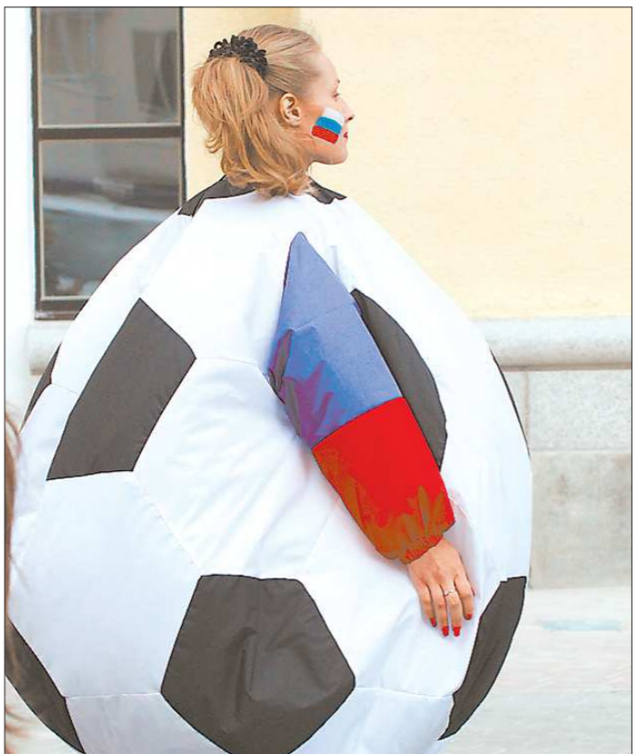
Весь последний год Екатеринбург создавал образ любимого города, одевая то людей, то гигантские шары у горадинстрации в «пятнистую» одежду. Поверят ли нам чиновники ФИФА?

Е.Я.: Конечно, развитие инфраструктуры — это здорово. Но почему то, что нужно нам самим, надо делать обязательно для кого-то? Один мой коллега год назад около месяца провёл в Лондоне и его окрестностях, и, по его рассказам, он не заметил, чтобы в британской столице как-то особенно готовились к Олимпиаде — реконструировали стадионы и аэропорты, строили гостиницы и дороги. Потому что там это уже построили для собствен-