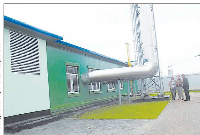
В Верхнем Дуброво пять работающих на газе муниципальных котельных. Эта — самая современная

Её строительство осуществлялось в рамках реализации областной целевой программы «Модернизация и реконструкция ЖКХ». Этот современный объект инфраструктуры жилищно-коммунального хозяйства позволит жителям городского округа стабильно получать тепло и горячую воду.