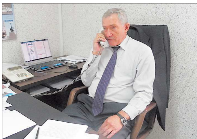
На календаре в кабинете мэра — сентябрь. Но думать ему приходится на год вперёд.

«И ещё раз могу повторить: не по средствам живём! Придя на пост главы, я проанализировал ситуацию и, по большому счёту, понял, что город — банкрот. Взяла на себя огромные обязательства в рамках различных государственных целевых программ, федеральных и областных, которые местный бюджет при всём желании исполнить не в состоянии. Сегодня годовая бюджет городского округа — около 420 миллионов рублей, а для выполнения всех программ (а их нам в наслед-