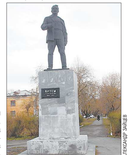
Памятник товарищу Артёму установлен в городе в ноябре 1966 года на улице Комсомольской. Скульптор — Анатолий Ключев

КСТАТИ. Осталась железнодорожная станция Егоршино, которая известна каждому служившему в армии как областной пункт сбора призывников.