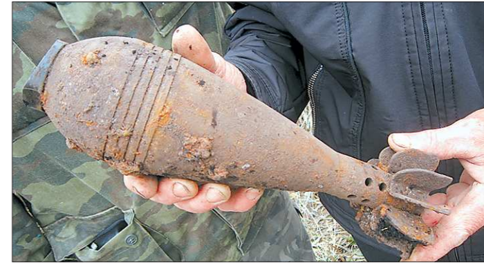
Специалисты установили - снаряд боевой, при неосторожном обращении мог бы и сдетонировать

У селян после уборки урожая картофеля появилась возможность уделить внимание и другим делам по хозяйству. И занятие это порой приносит самые необычные плоды.