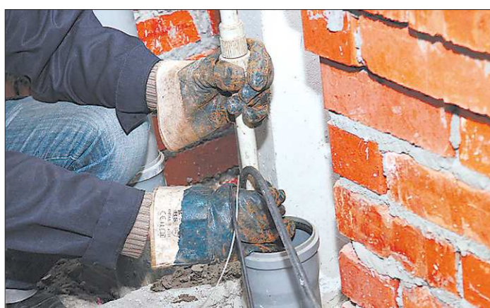
Аварийная бригада снова направила щупальца «Спрута» в трубу «нехорошей» квартиры