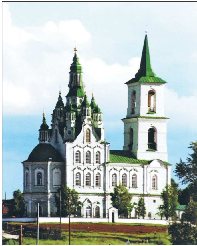
Спасо-Преображенский храм в Нижней Синячихе

— Конечно, на каждую свободную минутку старался свои знания пополнять, читал Рериха, Стасова, любил Паустовского. Книжки и покупал, и из больших библиотек выписывал. На одном из снимков мы альбом с репродукциями