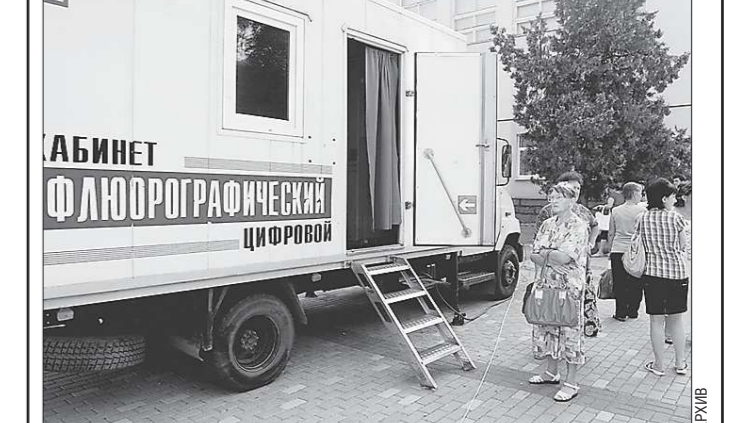
Как рассказывают фтизиатры, в среднем за один час работы передвижного флюорографа обследование проходит 15 человек

Всем, кто старше 15 лет, не реже чем раз в два года, нужно делать флюорографию грудной клетки. Статистика такова: один больной заразной формой туберкулеза в год может инфицировать 10-15 человек, один из которых заболевает. Вероятность возникновения туберкулеза наиболее высока в первые два года после заражения. Развитие заболевания зависит от иммунитета. Риск заболеть туберкулезом у человека с нормальной иммунной системой составляет 10 процентов, у лиц с иммунодефицитом - 50 процентов. Из факторов, способствующих развитию туберкулеза, в первую очередь следует назвать плохие жилищные условия, неполноценное питание, алкоголизм, курение, наркоманию.