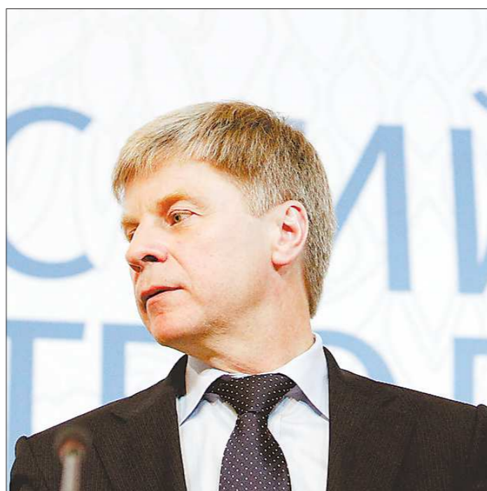
Новый президент РФС считает, что футбол в России пошёл не по тому пути. Посмотрим, какой путь предложит он

После того, как были объявлены итоги голосования, пошла уже волна комментариев. Порой довольно смешных. Так, один из претендентов на пост президента РФС, заместитель председателя Госдумы Игорь Лебедев сослался на несостоявшегося тренера сборной России итальянца Роберто Манчини, который якобы сказал, что «если этот хмурый человек, понимающий только русский язык, будет избран президентом РФС, то будущего у футбола в России нет». Можно подумать, что наличие обаятельной улыбки — глав-