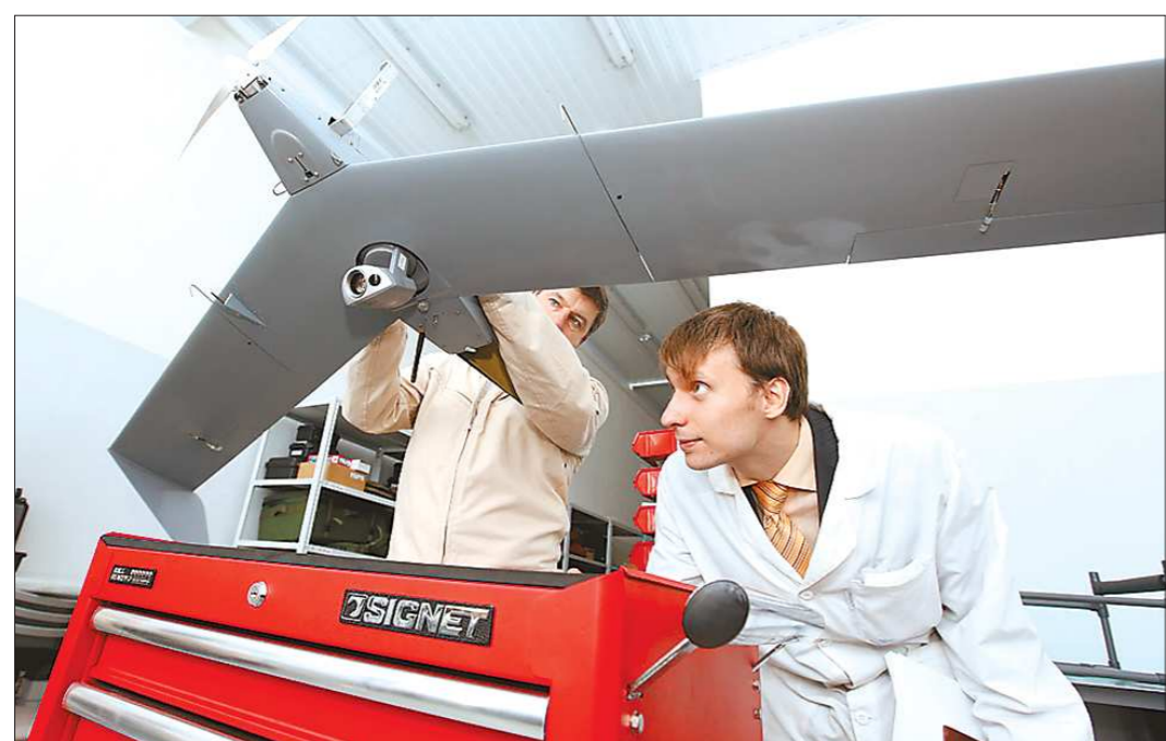
Первые свердловские беспилотники пройдут лётные испытания в октябре-ноябре этого года