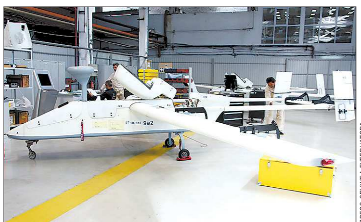
Такой аппарат летает без пилота, но управляет им всё-таки человек, с земли