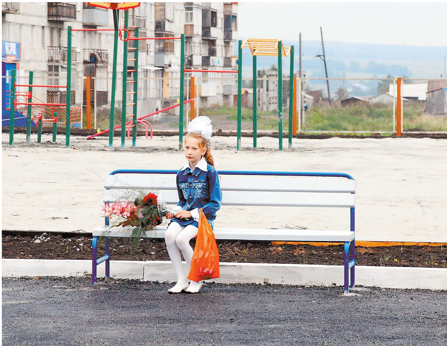
Первое сентября встречаешь с особым волнением, если идёшь в новую школу, незнакомый класс. Как тебя встретят?

Спустя два года мне вновь пришлось уезжать. И теперь я переходила не просто в