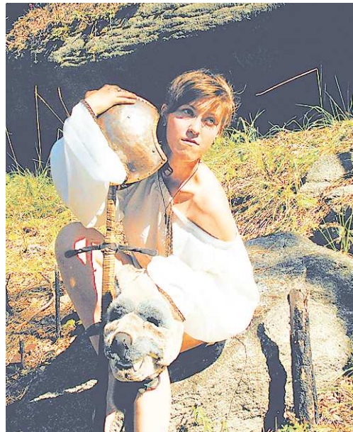
Важная часть арт-фехтования – костюм. Его, а также маски участники поединков мастерят самостоятельно.