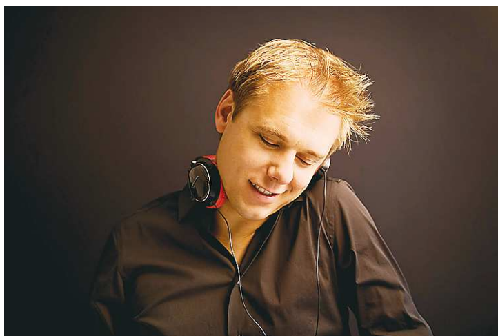
Улыбка – визитная карточка Армина ван Бюрена.

Свою популярность электронная музыка начала обретать ещё в 80-е годы прошлого века. Основной аудиторией слушателей стали молодые люди, которые активно посещали ночные клубы. На танцевальных площадках в те времена было не протолкнуться. Каждый мечтал попасть в клуб, чтобы хоть краем уха услышать синтетические мелодии, записанные без единого музыкального инструмента. Со временем у «электронники» появилось много различных направлений: транс, техно, хаус, недавно, кстати, зародилось совсем новое ответвление