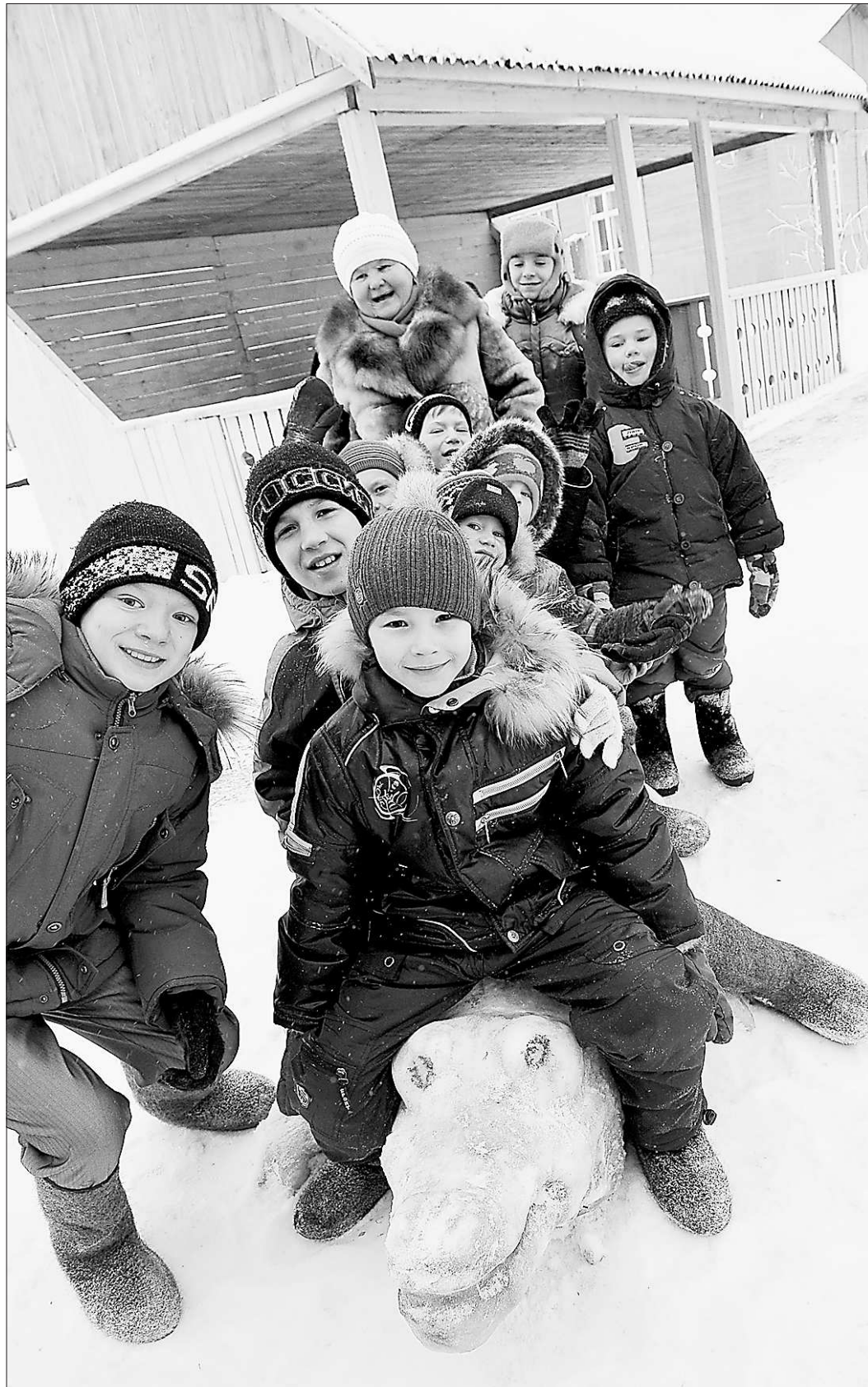
В детдоме «Огонёк» все добрые, даже крокодил

Согласно последней переписи населения, жителей в Вершине нет. Уехали, ушли из жизни. Хотя, пробравшись по зимнику в этот заповедный уголок, можно воочию убедиться, что он обитаем. Призраки человеческого присутствия несут на себе деревянные избы привычных нам очертаний, и другие, более приземистые, будто придавленные к земле немалыми здесь снегами, и типичный мансийский амбар – сомях, избушка на грухях нож-