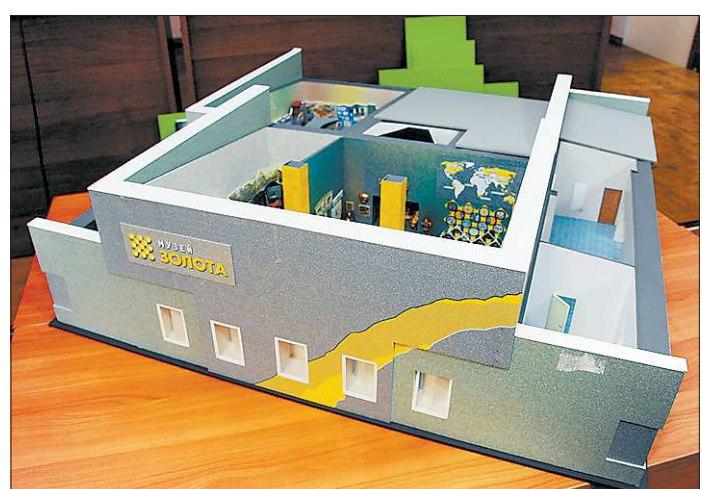
Макет обновлённого здания

– Берёзовский краеведческий музей всегда позиционировался как музей города, где нашли и добывают золото. Мы хотели расширить и возвысить это понятие до