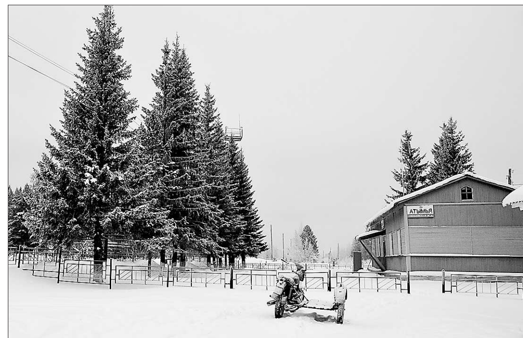
Атымья – станция немногочисленная

Откуда брать кадры, если не из прилегающих посёлков, той же Атымьи? Так что жить на обочине магистрали – это не значит жить на обочине жизни. Атымья ещё найдёт себя.