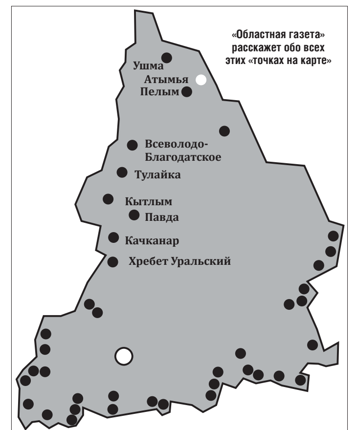
«Областная газета» расскажет обо всех этих «точках на карте»