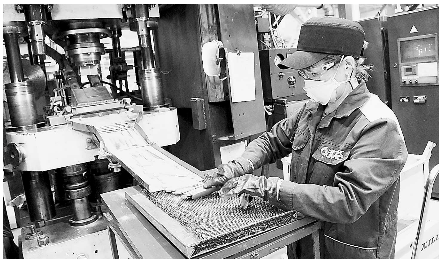
Новая техника максимально удобна и безопасна для рабочих

Р.С. Будет ли такая специальная программа, пока неизвестно, но в своем выступлении министр финансов заявил, что «это можно внести и через нормативно-правовое поле».