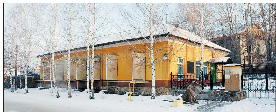
Старый музейный дом

Ответ был дан коллективный – на экстренном заседании Совета лиги. Клубы ПБЛ заявили, что не против объе-