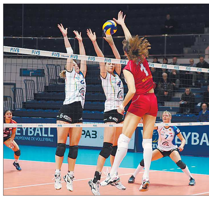
В Европе, в отличие от России, «Уралочке» играть в плятках не разрешили, и на матч с «Алупрофом» команда вышла в шортах

Ответный матч пройдет в Польше 18 января.