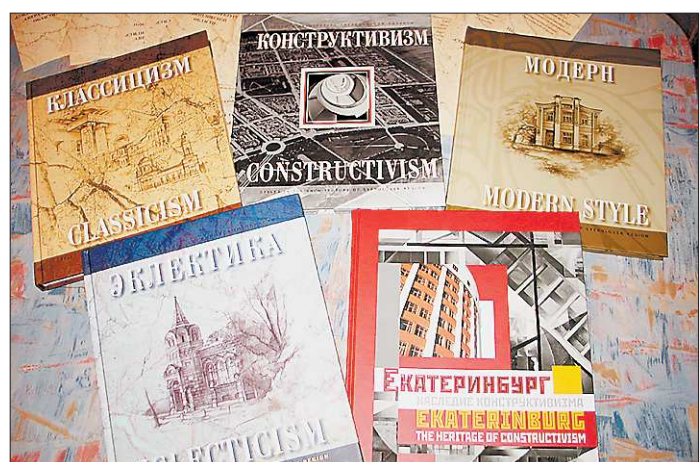
Последний том - «Неоклассицизм» - так и не попал в кадр, поскольку на презентации переходил из рук в руки