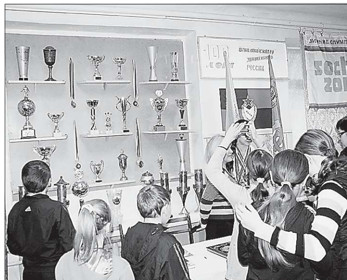
Спортивные достижения, трофеи последних лет также нашли своё место в музее