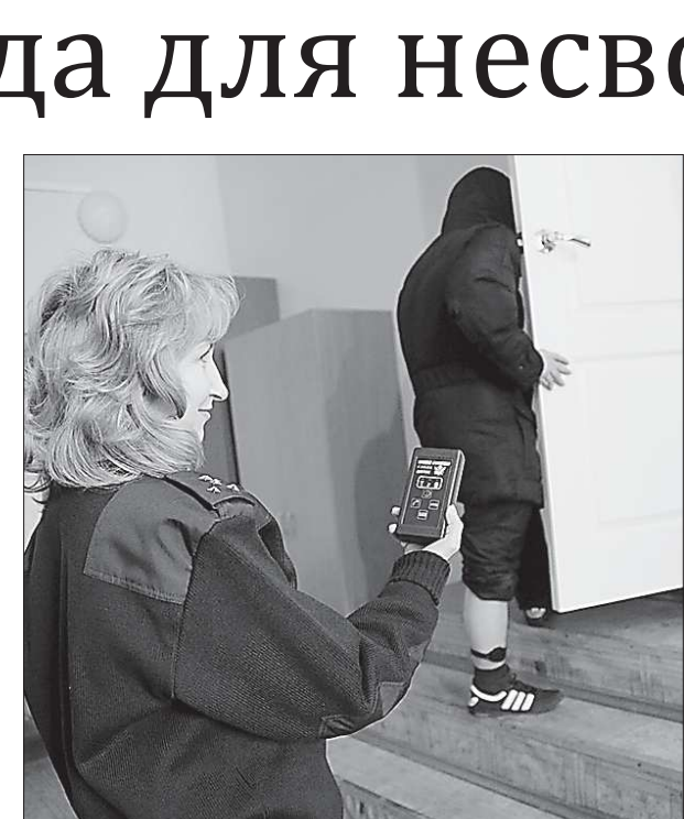
Этот браслет-контроллер отслеживает каждый шаг осужденного с точностью до метра

«Во-первых, все указанные в антирейтинге управляющие компании – самые крупные в Екатеринбурге. Понятно, что если УК управляет большим жилфондом, то количество нарушений и жалоб населения больше. Во-вторых, в прошлом и начале этого года, как никогда ранее, УК являлись заложниками некачественной работы энергетиков. Срыв сроков начала отопительного сезона, аварии на внешних сетях – это основные причины жалоб жителей. К сожалению, идет смешивание понятий, что УК является чуть ли не подразделением энергетиков.