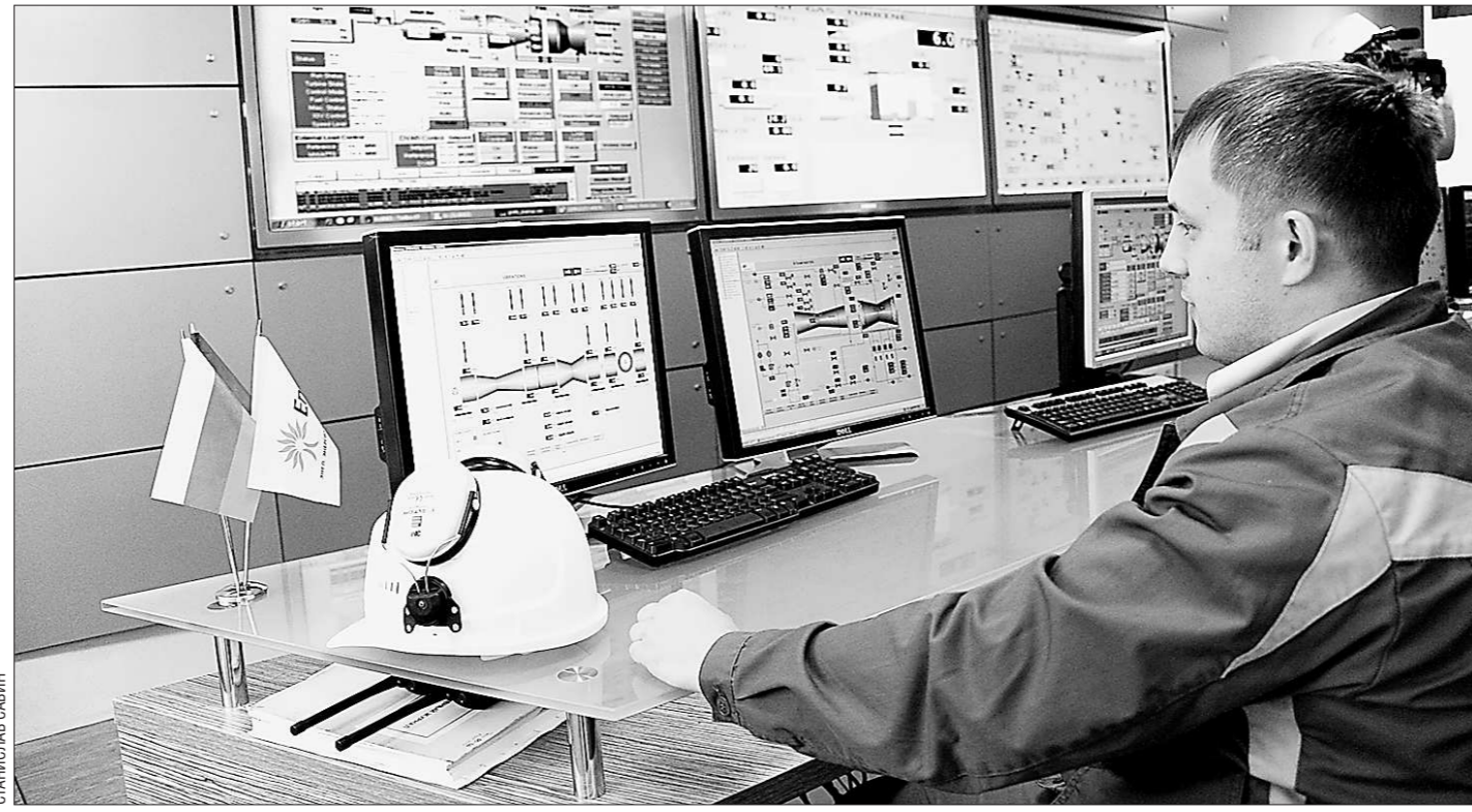
Мощность СУГРЭС выросла на 400 мегаватт