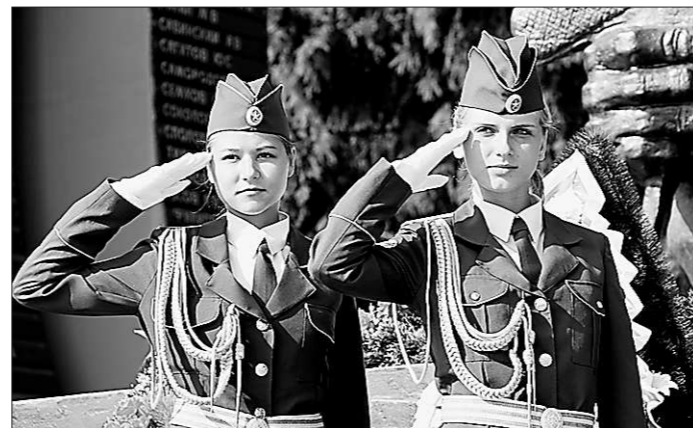
Кто сказал, что девочкам не интересны военные игры? По условиям конкурса в каждой команде – три девушки и восемь юношей

Вплоть до второго августа ребята из военно-патриотических клубов общешкольных учреждений страны будут показывать свои умения и на практике, и в теории. Участие в спартакиаде принимают около 250 человек из 15 регионов. Честь Свердловской области на этих соревнованиях защищают две команды – из села Кочневское Белоярского городского округа и из города Полевской. Они стали победителями областного этапа,