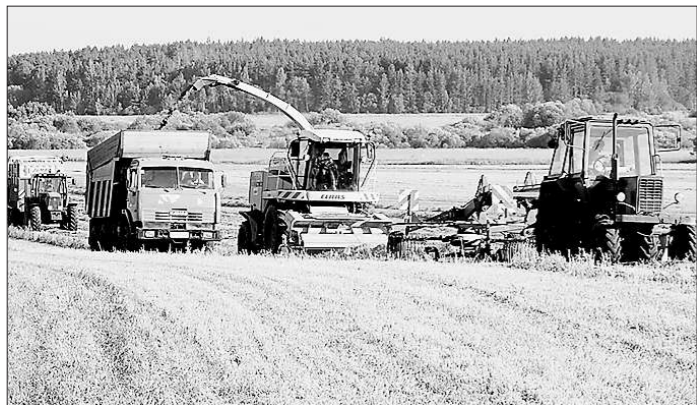
На кормовых угодьях нынче тесно от техники

Решили — сделали. Покупали чапаевцы так называемый «сенаж в упаковке», он им понравился. С этого года стали производить его сами. Приобрели необходимое оборудование, теперь укладывают сенаж не в траншеи, а в специальный полиэтиленовый рукав, который гарантирует сохранность корма. Глядя на соседей, такую же технологию внедрили нынче в двух других алапаевских хозяйствах — СПК «Пламя» и ООО «Ямовское».