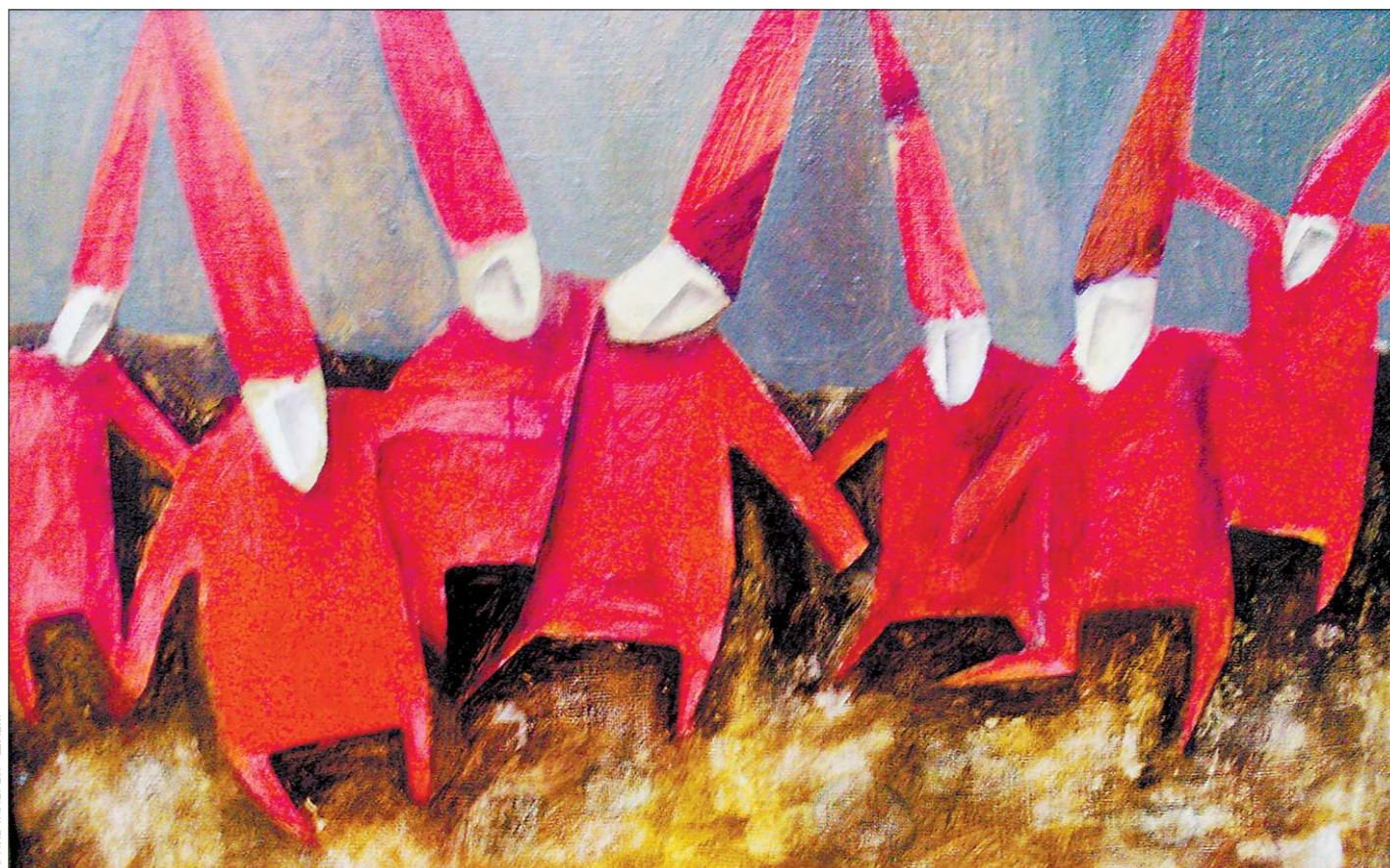
Работа Серёжи Пикассо «Танец гномов, или Последняя капля – твоя»

Без остановок на железной дороге читать будут в июле, августе и сентябре – до тех пор, пока студенческий «Экспресс» на линии. Затем – остановка: у ребят начнётся учебный год. Дальнейшее сотрудничество библиотеки и отряда проводников обсудят после подведения итогов железнодорожного чтения. Одно пока очевидно: «Читаем без остановки-2011» – только начало долгой дружбы, основа которой – книга.