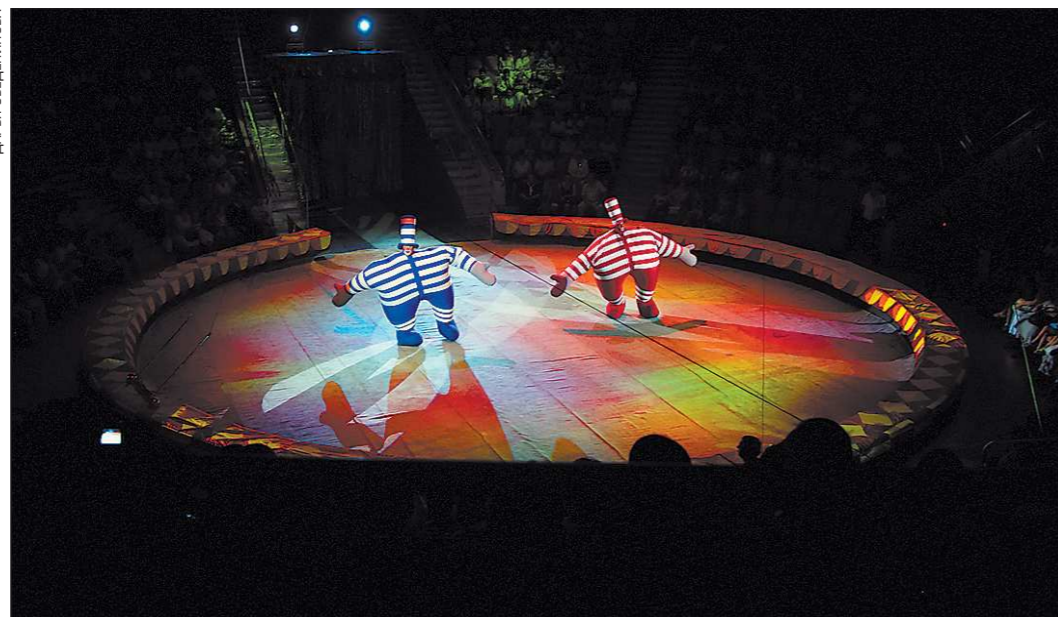
Клоуны «Шаривари» порой неуклюжие, но от этого ещё более смешные

Выступают перед зрителями и другие представители животного мира: медведи и