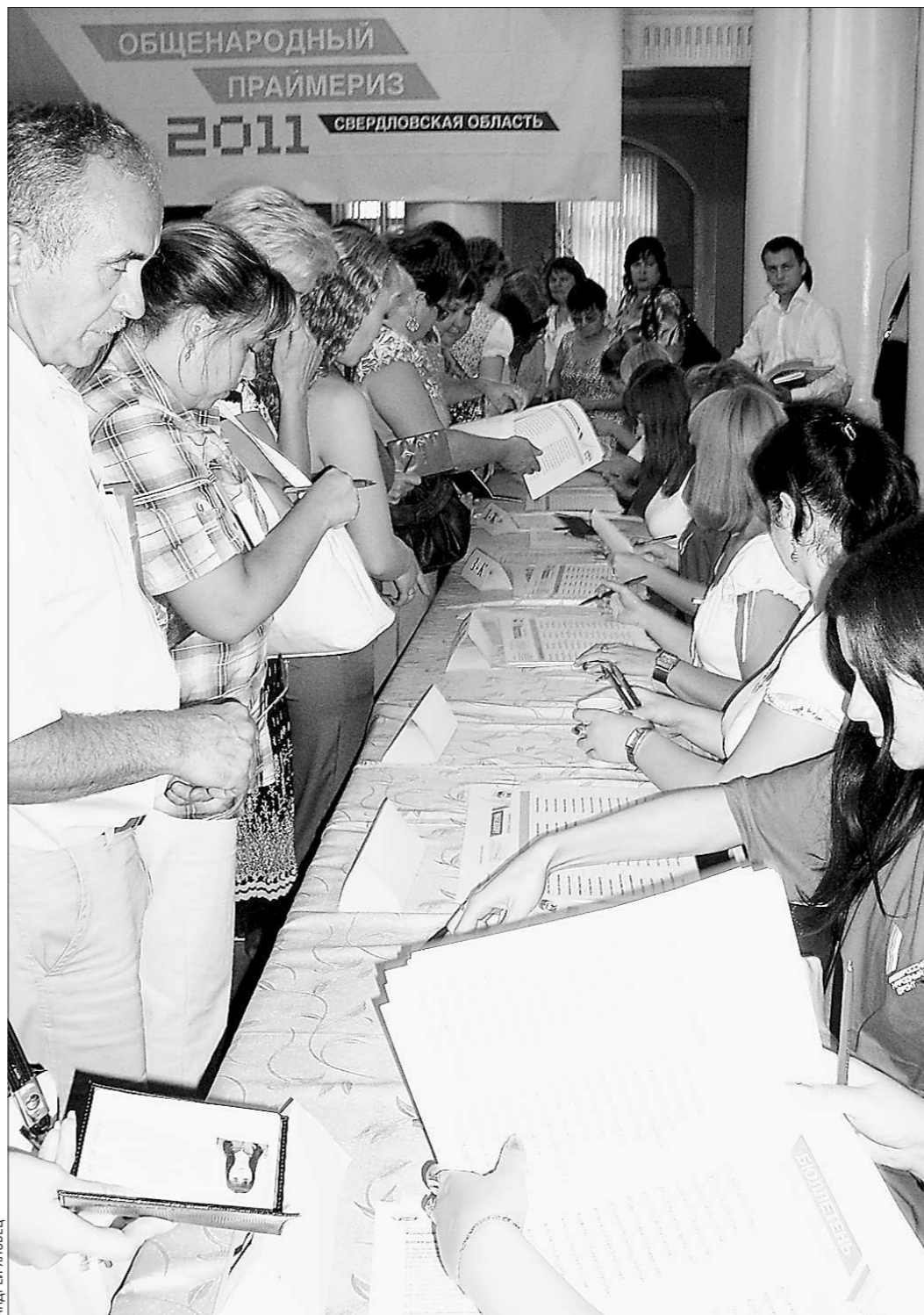
Первый праймериз: идёт голосование в Богдановиче