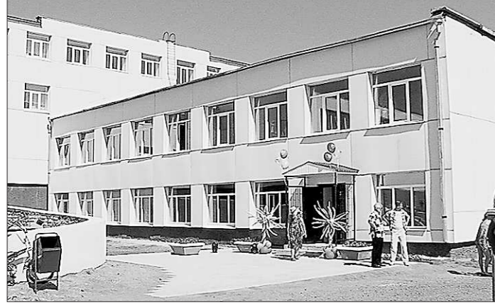
К новому учебному году школа искусств «одета с иголочки»