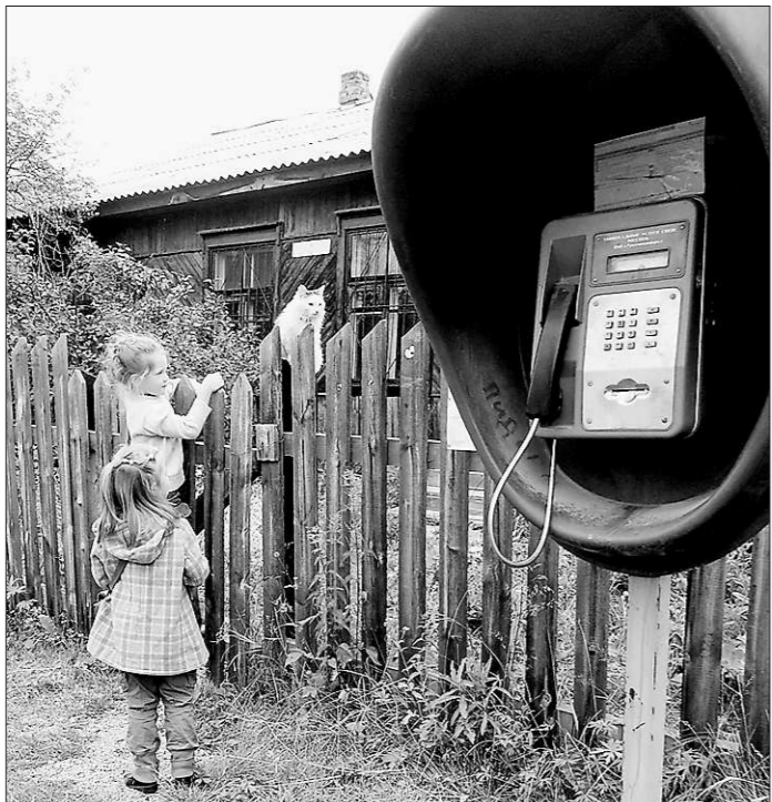
О своём «красном» таксофоне сагринцев в «ночь икс» вспомнили в последнюю очередь

Организатором такой необычной пресс-конференции выступило интернет-издание Lenta.ru. В числе вопросов, присылаемых из разных концов страны, «лёгких» практически нет. А трудных, острых, колочих — огромное множество. Есть и откровенно провокационные. Например, некий Максим, забыв поздравиться, написал: «После событий в Сагре вы стали на сторону нападавших уголовников. Почему?». Впрочем, может быть, туда, где живёт Максим, информация о сагринских событиях и о том, какое участие приняла в судьбе посёлка свердловский облбдсмен, дошла в таком вот, перевёрнутом с ног на голову, виде.