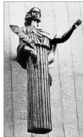
Муза кино благословляет всех входящих в Екатеринбургский Дом кино

– Как он может быть любимым? Сколько на него смотришь, читаю его сонеты, разглядываю росписи, с него рисую, всё время открываю что-то новое. У Эрнста Неизвестного альбом в четыре раза больше моего, стоит на политре — профессиональная книга, он с него постоянно рисует. Не срисовывает, а фиксирует идеи, которые рождаются. Это паразитно. Он не так много сделал, но его архитектура — потрясающая. Образованный во всех областях.