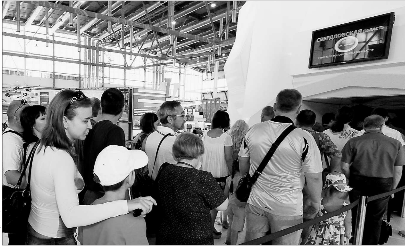
В этом году выставку посетили 40 тысяч человек — в два раза больше прошлогоднего. Особенно привлекала экспозиция, посвящённая будущему Свердловской области

го союза промышленников и предпринимателей Александр Шохин ответил на этот вопрос так: «Безусловно, надо использовать все возможности для внедрения инноваций. Можно, конечно, идти своим путём и вершить собственные инновации. Но на это потребуется время, за которое конкуренты могут уйти вперёд».